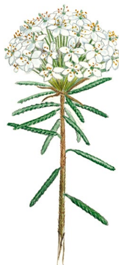
Skvattram Illustration Lennart Molin