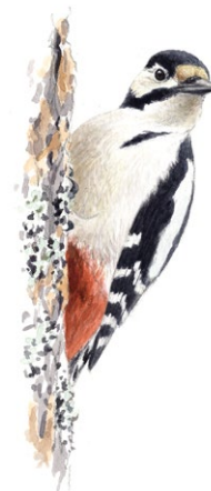
Större hackspett Illustration Niklas Johansson