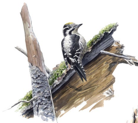
Tretåig hackspett Illustration Niklas Johansson

I reservatet har den tretåiga hackspetten observerats. Det är nära dess sydgräns, den sällsynta fågeln finns idag framförallt i norra Sverige. Tretåig hackspett trivs i skogar med döda och döende träd, därför har arten svårt att klara sig i vår tids ”välstädade” skogar. Särskilt vintertid behöver den utnyttja vidsträckt områden av orörd skog för att söka föda.