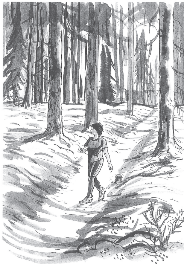
Hålvägar är vanligast i sandig mark. Tramp av fötter och hovar har bildat de skålformade rännorna. Hålvägar är känsliga för marktryck.

Färdvägar är ofta svåra att datera, men närheten till andra lämningar kan ge en fingervisning om vägens ålder. Vägsträckningar som passerar förbi runstenar och järnåldersgravfält har använts åtminstone sedan dess. Men färdvägar är ofta betydligt äldre än så.