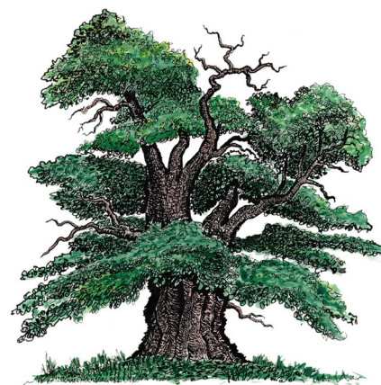
Illustration: Michael Holmberg

Över 1000 arter är mer eller mindre beroende av ek och eken intar en särställning som värdräd för olika lavar, insekter och svampar. Men det duger inte med vilka ekar som helst. Det är de gamla, grova och ofta ihåliga ekarna med solbelyst bark som är mest intressanta. I takt med att sådana träd blir allt ovanligare har också de arter som lever i och på dem blivit allt sällsyntare.