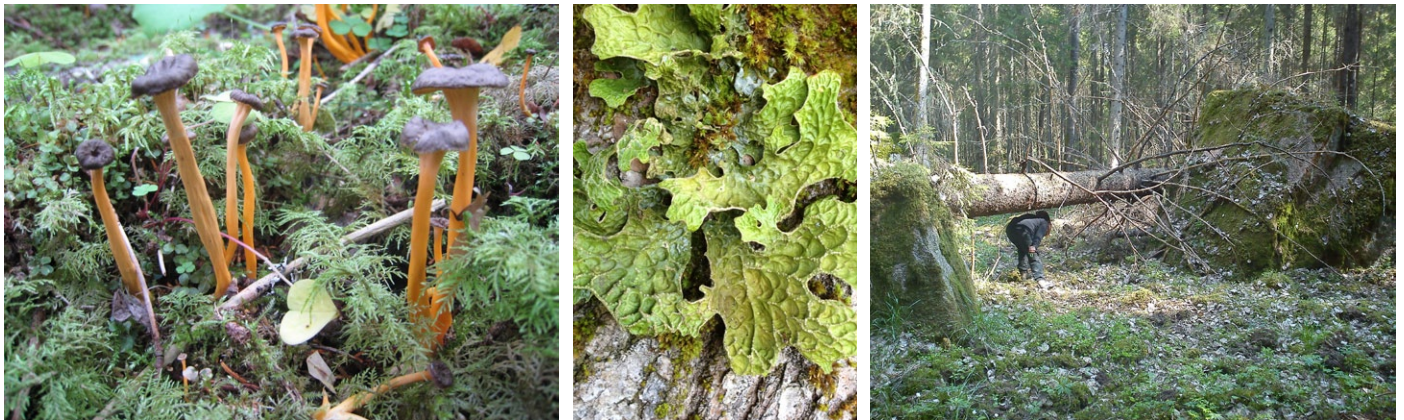
Rödgul trumpetsvamp, lunglav och omkullfallna träd kan du hitta i Norrbyhammar.

Naturreservatet Norrbyhammar består mestadels av barrblandskog med ett stort inslag av asp. På aspstammarna finns en rik flora av mossor, lavar och svampar.