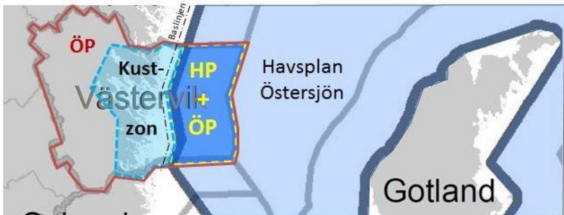
Figur 1. Principskiss som visar kommuntäckande ÖP med röd linje, havsplanområde med ljusblå färg och överlappande ÖP/HP-område i mörkblått med gul ram. Kustzonen är ett ungefärligt begrepp och området som redovisas i figuren är en uppskattning av Länsstyrelsen.

HaV har avsatt pengar till KOMPIS-bidraget för 2016 och 2017. Kommunerna kan söka bidrag antingen för ett ettårigt projekt för 2016 eller för 2017. Möjlighet finns även att söka för projekt som sträcker sig över en tvåårsperiod, det vill säga över 2016-2017.