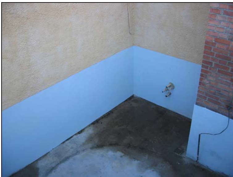
051118, hål igensatt efter tillstånd från länsstyrelsen