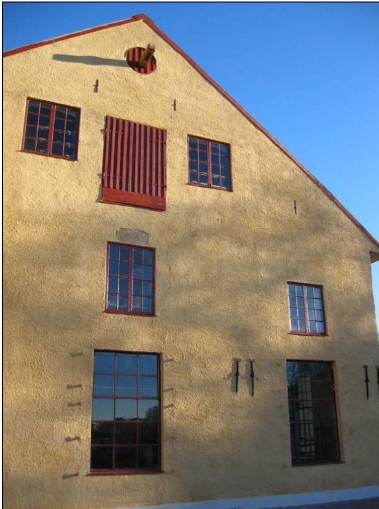
051118, den färdiga fasaden