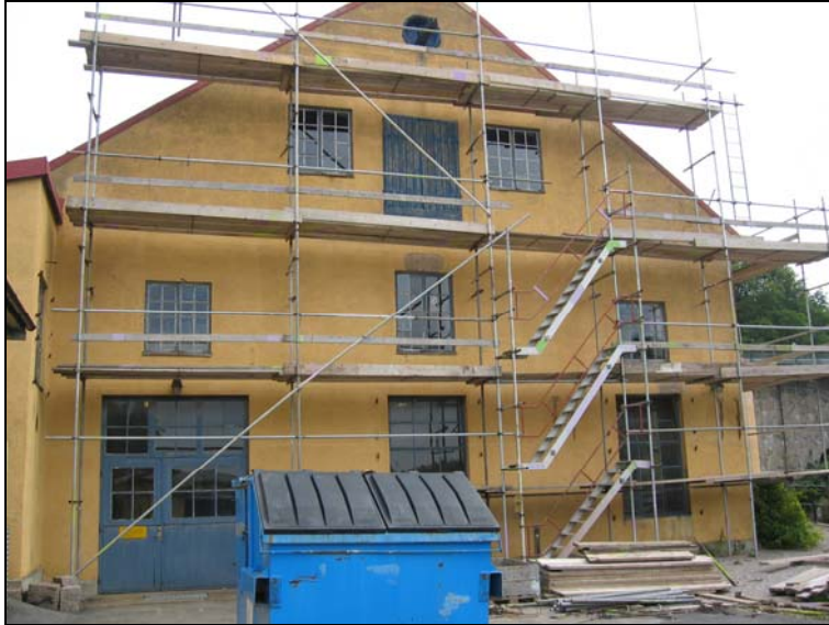
050816, den gamla putsen