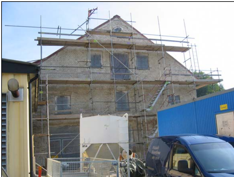
050907, putsen nedknackad