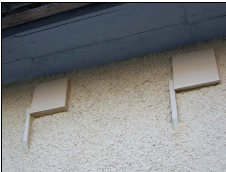
051118, ny plåt på balkändarna