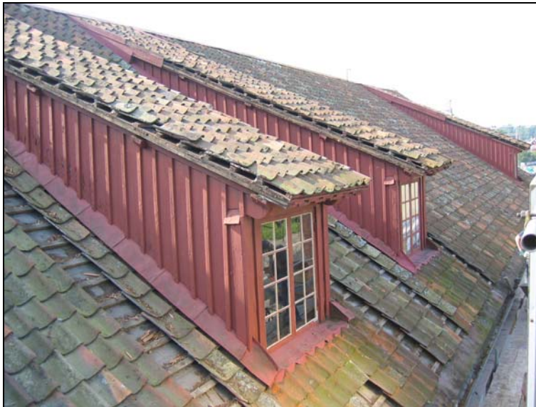
050907, det gamla taket