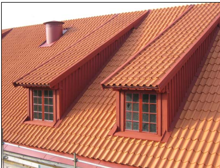
051021, nytt Vittinge lertegel