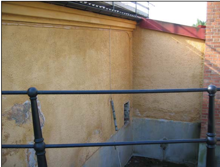
050824, hål i fasaden