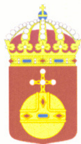
LÄNSSTYRELSEN UPPSALA LÄN