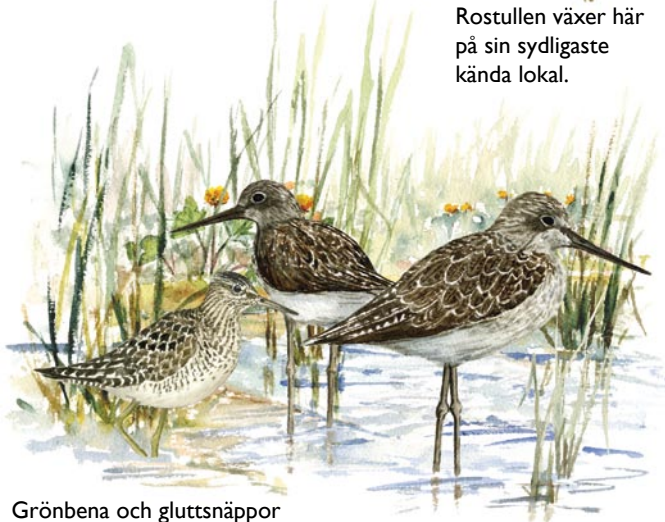
Grönbenor och gluttsnäppor