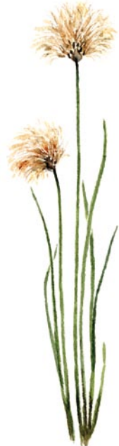
Rostullen växer här på sin sydligaste kända lokal.

Mitt i reservatet ligger Postmyran. Förr färdades brevbärarna till fots genom dalgången, lastade med post som skulle mellan Sorsele och Arjeplog.