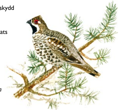
Järpe Bonasa bonasia