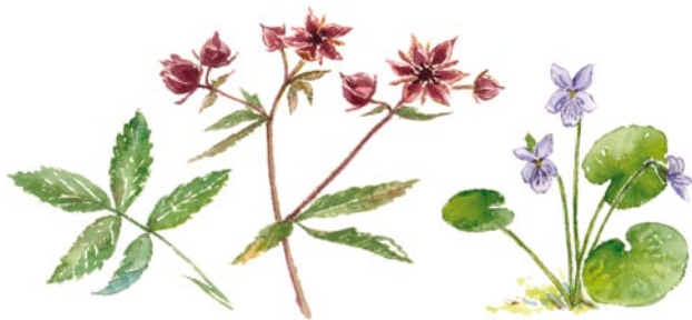
Kräklöver Comarum palustre och Kärrviol Viola palustris

Skravelsjöbäckens ravin öster om berget är vildvuxen med höga naturvärden. Längs bäcken dominerar gråal och björk medan granskog med stort inslag av asp, tall, sälg och björk tar över en bit upp från bäcken. Här finns gott om döda träd i olika former och nedbrytningsstadier. Vegetationen präglas av det fuktiga läget med höga ormbunkar som majbräken och nordligt lundbräken samt brunrör, kräklöver, topplösa, missne, kärrviol och kärrdunört. Mossor som kranshakmossa, rosmossa och palmmossa trivs också i den fuktiga ravin.