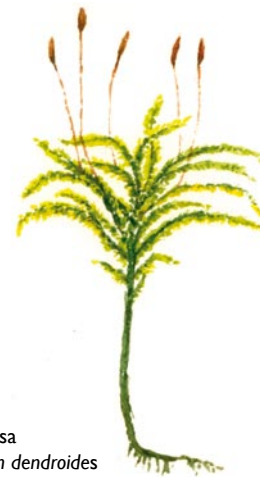
Palmmossa Climacium dendroides

Det är fantastiskt vackert utmed Umeälven. Besök sevärdheter som Arboretum Norr, hällristningarna i Norrfors, laxhoppet eller soldattorpet i Brännland. Från Umeleden vid Notvarpsbron och Klabböle kraftverksmuseum är det bara ett stenkast till Hässningsberget.