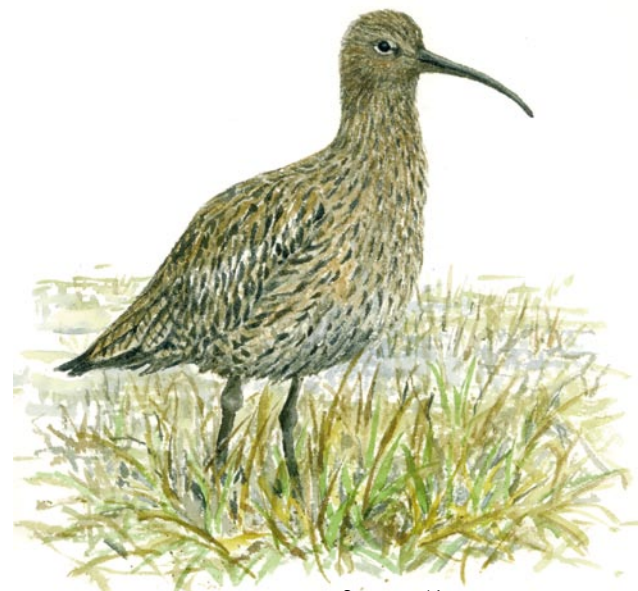
Storspov Numenius arquata

Gärdefjärden har bildats genom att landhöjningen snört av den ursprungliga havsviken. Vattenytan ligger nu fyra meter över havet. Mångbyån i reservatets nordvästra del utgör det viktigaste tillflödet till fjärden. Utflödet sker via den grävda kanalen, Strömmen, som binder ihop Gärdefjärden och Avafjärden. Fjärden har troligen sänkts två gånger, någon gång på 1850-talet och 1931.