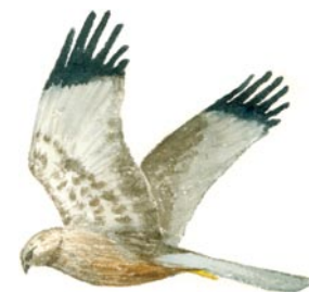
Brun kärrhök Circus aeruginosus

There are lake-side meadows and farmlands with stands of both hardwood and mixed forest trees.