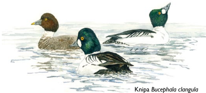
Knipa Bucephala clangula

Gärdefjärden är en mycket viktig rastplats för fåglar under vår- och höstflyttningen. På våren ser man ofta stora mängder betande gäss och tranor på åkrarna kring sjön. Ljungpipare, brushane, rödbena och storspov kan ses i reservatet. Brun kärrhök och fiskgjuse ses regelbundet över fjärden. Häckfågelsbeståndet domineras av gräsand, knipa, kricka och vigg, men även ovanligare arter som dvärgmåsa, gråhakedopping och jorduggla. Sällsyntheter som brunand och mindre hackspett ses då och då.