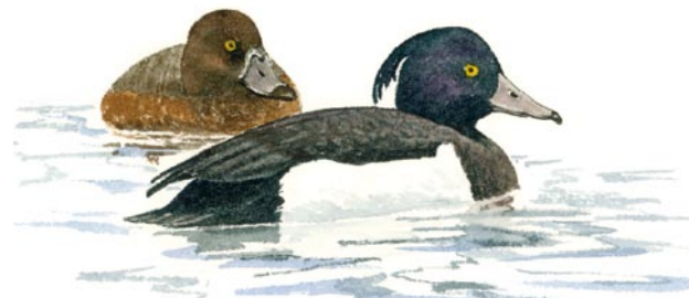
Vigg Aythya fuligula

Administration, management and information are financed by the County Administration of Västerbotten and the Swedish Environmental Protection Agency.