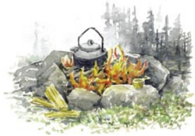
Välkommen att koka kaffe i Njakafjälls naturreservat. Elda med förnuft!

Alla borde ströva en dag på Njakafjäll. Här har en hotad gammelskog räddats till våra efterkommande. Efter en lång naturvårdsdebatt avsattes Njakafjäll som naturreservat år 2000.