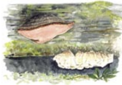
Rosenticka Fomitopsis rosea

Ordet njaka kommer av njakka, ett samiskt ord för den "otillgängliga". Trots detta har stora delar av skogarna påverkats av blädning. Det hindrar inte att 600 åriga granåldringar står kvar och att det finns mycket grova lågor med ovanliga svampar som lappticka, rosenticka och taigaskinn. Dessa märkliga organismer är ibland torra, hårda tickor eller vissa köttigt sega. Det ljusbrunt knottriga rynkskinnet skapar onämnbare associationer och den camembertdoftande osttickan är kungen bland Njakafjälls ovanliga svampar.