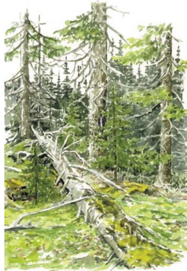
© Illustrationer och layout: Gun Lövdahl. Listera. Text: Tomas Staaffjord. Länsstyrelsen Tryck: Tryckeri City. Tryckt på svanemärkt Cyclus Print papper.