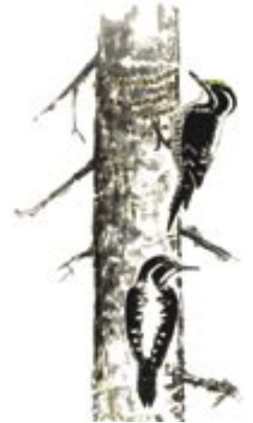
Tretåig hackspett Picoides tridactylus

I Njakafjäll kan man möta både ren och älg och kanske hitta ett gammalt björnide. Även vintern har mycket att erbjuda besökaren. Du kan spåra mård, hermelin och hare Varje vinter spåras järv och lodjur i Njakafjäll. Har man stor tur visar sig taigans stannfåglar, lavskrika, tretåig hackspett och lappmes, under ett besök.