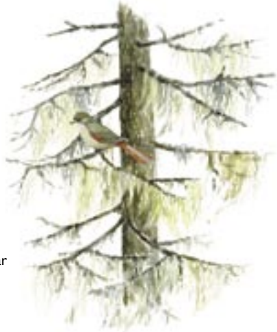
Gran med garnlavar och lavskrika Perisoreus infaustus

Reservatet ligger i förfjällen mellan Kultsjöåns och Marsåns dalgångar. Väg 1067 mot Saxnäs gränsar mot reservatet i söder. Härifrån går flera gångstigar rakt in i Njakafjäll. Väster om reservatet går en skogsbilväg in från Kultsjöluspen till Svartsjön. Skogsbilvägar går också in mot reservatet norrifrån mellan Grytsjö och Blaikliden samt österifrån via Hällmyrvägen söder om Marsån.