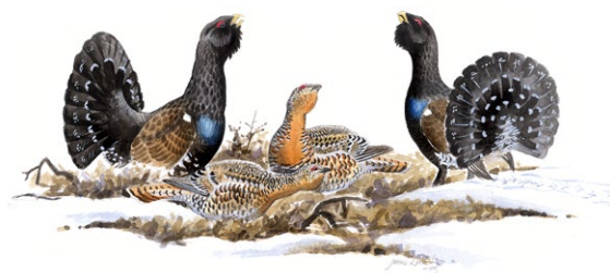
Tjäderspel Illustration Jonas Lundin

Hög och jämn luftfuktigheten gynnar reservatets fuktälskande mossor och lavar. En av dem är den sällsynta kalkkammosan. Den växer på block och lodytor vid bäcken som rinner längs bergbranten i väster. Längs bäcken finns också rikligt med gullpudra. Rutlungmossa, korall- och garnlav är andra arter som lever i reservatets fuktiga skogar.