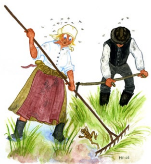
På 1800-talet skördades hö på strandängarna utmed Ängabäcken. Illustration: Margareta Hildebrandt

Den djupa sprickdalen i Viken ingår i den förkastningsbrant som formar sjön Tisarens branta södra strand. Ängabäckens fuktiga stränder på dalens botten har i äldre tid brukats som äng. Här skördades hö som vinterfoder till boskapen. Strandängarna är idag igenvuxna med skog. Sprickdalens branta sidor har gjort det svårt att bedriva ett modernt skogsbruk. Granskogen som klättrar uppför branterna på var sida om Ängabäcken är därför gammal. Här finns även gott om liggande, döda träd. Skogen i reservatet ska i framtiden få utvecklas fritt till en naturskog, där både gamla och döda träd lämnas kvar.