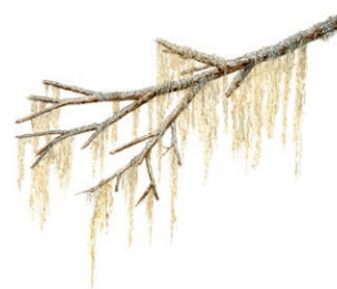
Garnlaven trivs i gamla, ljusa skogar. Illustration: Margareta Hildebrandt

Njut av en tyst och mjuk vandring genom reservatet på den gamla färdvägen som slingrar sig fram utmed bäckens östra sida. Här har människor färdats både till häst och till fots i äldre tider.