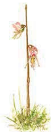
Skogsfru Epipogium aphyllum

Det är den lilla orkidén skogsfru som saknar det gröna klorofyllet och därför är så ljus. Istället för att ta upp solljus med klorofyll som andra gröna växter gör samarbetar hon med svampar i jorden. I den sumpiga gammelskogen som hon lever i trivs också många andra. Spår finns överallt längs stigen upp på berget. På granarnas stammar syns ringar av hack från den tretåiga hackspetten. Vedlevande svampar som lappticka och gammelgransskål växer här. Granarna är prydda med långa hänglavar. Döda gamla träd som elden en gång tagit ligger spridda. Vissa inslagna i ett frodigt täcke av vedtrappmossa och andra ovanliga mossor.