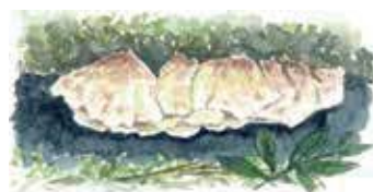
Lappticka som växer på liggande lågor är en mycket ovanlig, rödlistad art.