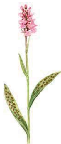
Jungfru Marie nycklar Dactylorhiza maculata