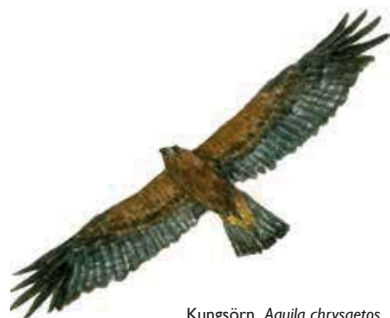
Kungsörn Aquila chrysaetos

Strax öster om kanjonens norra ände finns en fyra meter djup jättegryta. Den bildades när vattenströmmarna tvingade sig ner i berget. Jättegrytans botten har en diameter på drygt 5 meter.