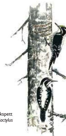
Tretåig hackspett Picoides tridactylus

I den fuktiga kanjonbotten förekommer sällsynta arter som skuggblåslav och trådbrosklav. Lavskrika är vanlig i området. Här finns också tretåig hackspett, tjäder och goda gnagarår tornfalk och pärluggla. Med lite tur kan man få se kungsörn eller spår av björn eller lodjur.