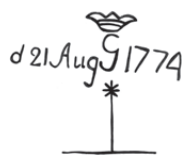
3 Vattenståndsmärke. Lägg märke till hur långt upp på land det ligger i dag.

När intresset för landhöjningen eller "vattuminskningen" tog fart under 1800-talet fick Ratan en central roll. Här högg vetenskapsmännen in vattenståndsmärken i berget på fastlandet redan från 1849. År 1891 uppfördes en så kallad mareograf – en vattenståndsmätare. Idag finns en ny mareograf och det är rapporterna från den som varje dag hörs i svensk radio.