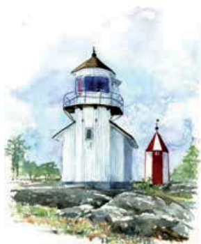
7 Fyr, båk och lots.

Utmed Rataskärs markerade stig finns intressanta lämningar från förr. I närheten av det gamla fiskeläget finns tomtingar, labyrinter och en kompassros. Närmast stranden finns resterna av en sjötullkammare samt världshus som minner om Ratans storhetstid under 1700-talet.