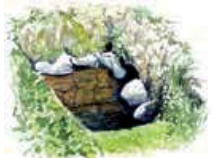
2 Källan och världshuset. Källan gav vatten till det världshus som låg här.