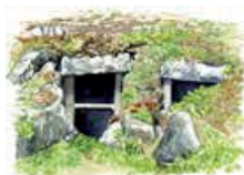
1 Sjötullkammaren. Rester efter det som en gång var en sjötullkammare. Från 1767 till början av 1800-talet förtullades alla varor som fördes ut och in i Västerbotten på Rataskär.

På toppen av ön står fyren som uppfördes 1891 och den gamla fyrbåken. Fyrbåken användes innan fyren kom till. Fyrbåken var en hög konstruktion som man gjorde upp eld ovanpå. Då såg sjömännen elden på långt håll och visste att de närmade sig land.