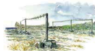
5 Fiskeläget. Rester av ett fiskeläge med tomtingar/ husgrunder och gistvallar. Bilden visar hur näten torkades, i dag kan du här hitta gistgårdsrosen i rader.