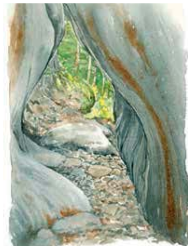
I Lidbergs-grottorna finns flera rundslipade sprickgrottor