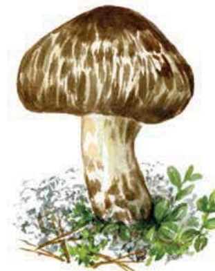
Goliatmusseron Tricholoma matsutake

Mellan Huvudåsen och Kullen kan du se några stora fördjupningar som kallas för åsgravar. Sådana förekommer ofta bredvid rullstensåsar. När is som blivit kvar från inlandsisen smälte skapades sänkorna. I botten av gravarna växer ingen skog, kanske för att kall luft samlas där under sommaren.