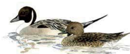
Stjärtand Anas acuta

I Brånsjön nära Vännäsby kan rastande och häckande fåglar frossa i häpnadsväckande mängder insekter. Sjön är också en av Västerbottens riktiga pärlor för oss som uppskattar utflykter i naturen. Ta med välfylld fikakorg och kaffetermos. Vid sjöns fågeltorn njuter du sedan av vacker och rik Västerbottensnatur.