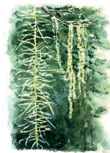
Långskägg Usnea longissima

Stigen upp till Balbergets topp är ganska krävande och brant, men väl uppe väntar belöningen i form av vidunderlig utsikt över det västerbottniska skogslandskapet. Öreälvens djupa nedskärning syns vackert inte så långt från Balberget och skogen böljar kulligt.