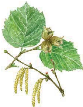
Hassel Corylus avellana

I Balbergets naturreservat finns en spännande blandning av fjällväxter och arter man annars hittar i södra Sverige. Fjällhüllebräken, blågröe, fjällnejlika och fjällbräcka samsas med brakved, liljekonvalj och nattviol. Den sydvända branten fångar upp solvärmen och skapar ett gynnsamt klimat för växter som annars inte klarar den norrländska kylan.