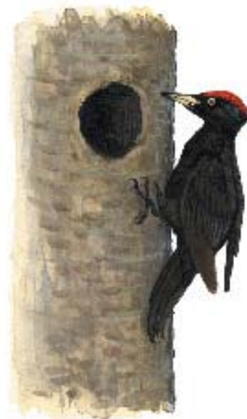
Illustration: Michael Holmberg

Stora mängder kol behövdes till de många masugnarna, vilket gjorde att en omfattande kolning bedrevs i skogarna kring hyttorna. Lämningen efter kolmilan, den så kallade kolbottnen, består oftast av en cirkelrund svag upphöjning i marken som vanligen är 5 – 8 meter i diameter, ibland större.