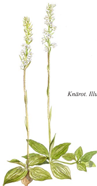
Knärot. Illustration: Jonas Lundin

Den höga luftfuktigheten i ravinerna gynnar också sällsynta lavar. Vid stambasen av grova granar kan man bland annat hitta kattfotslav. På asp växer skinnlav och bårdlav. Även mossorna trivs och skogen är täckt av en grön mossmatta med inslag av lite ovanligare arter som mörk husmossa och skogshakmossa. I mossmattorna kan man stöta på knärot, en liten vitblommig orkidé som hör hemma i äldre granskogar.