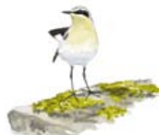
Stenskvätta Oenanthe oenanthe

Välkommen att vandra längs stigarna i Äskhult men visa alltid hänsyn till människor, djur och natur. Var uppmärksam på att särskilda föreskrifter gäller i reservatet.