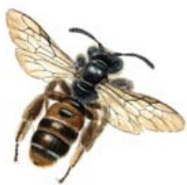
Väddsandbi Andrena hattorfiana