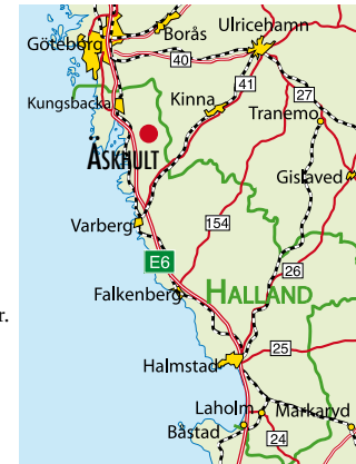
Från E6, tag av vid Fjäråsavfarten. Följ skyltad väg till Äskhult via Gällinge, totalt ca 1,4 mil.

434 81 Kungsbacka 0300-83 40 00 www.kungsbacka.se