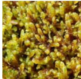
Kärrknipprot bland axag, majjviva och späd skorpiomossa.