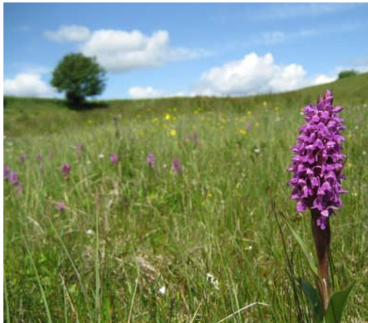
Majnycklar i rikkärr på Österlen.