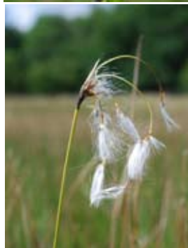
Flugblomster och gräsull.