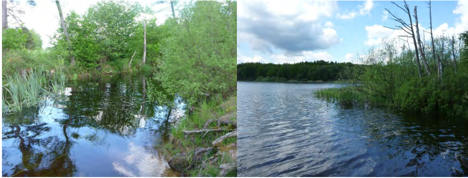
Figur 5. Sjömellets inlopp i Ballingslövssjön samt sjöns norra del i anslutning till inloppet.