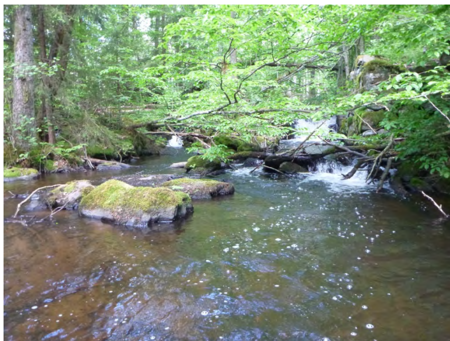
Figur 7. I Pinkabäcken hittades musslor nedströms det gamla fallet vid Tockarps före detta såg.

Musslor samlades in från Sjömellets inlopp samt Ballingslövssjöns norra strandzon. Sammanlagt hittades tre arter stormusslor: spetsig målarmussla ( Unio tumidus ), äkta målarmussla ( Unio pictorum ) och allmän dammussla ( Anatina anatina ), (Figur 8). För utförligare information av musseldata, hänvisas till musselportalen ( www.musselportalen.se ).