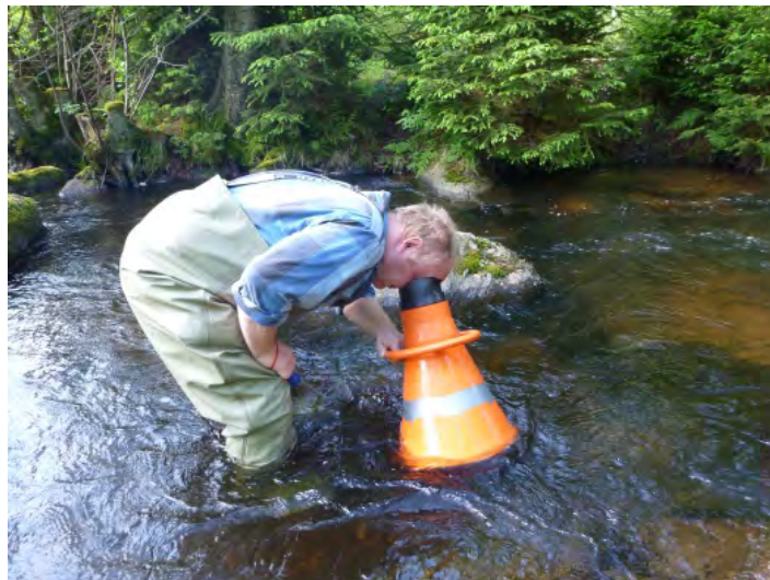
Figur 6. Noggrant eftersök av musslor i Pinkabäcken, med hjälp av vattenkikare.

Utöver musslorna sågs rikligt med fisk, ett stort stim med uppskattningsvis ca 300 mörtar och minst 5 abborrar. Mörtarna förmodligen uppvandrade från Ottarpsjön för att leka.