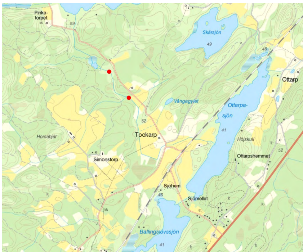
Figur 2. Pinkabäcken avvattnar Lursjön varifrån vattnet rinner ner till Ottarpasjön, vidare till Ballingslövssjön och därifrån ut i Almaån. Start- och slutpunkter för inventeringen är markerade med röda cirklar. Pinkabäcken tillhör vattenförekomsten Lilla å EU_CD: SE623624-138119, rinnsträcka RSTID: 62368571380102. Lursjön är vattenförekomst (EU_CD: SE623811-137924) medan Ottarpasjön och Ballingslövssjön är övriga vatten (NW623651-138131 respektive NW623505-138027).