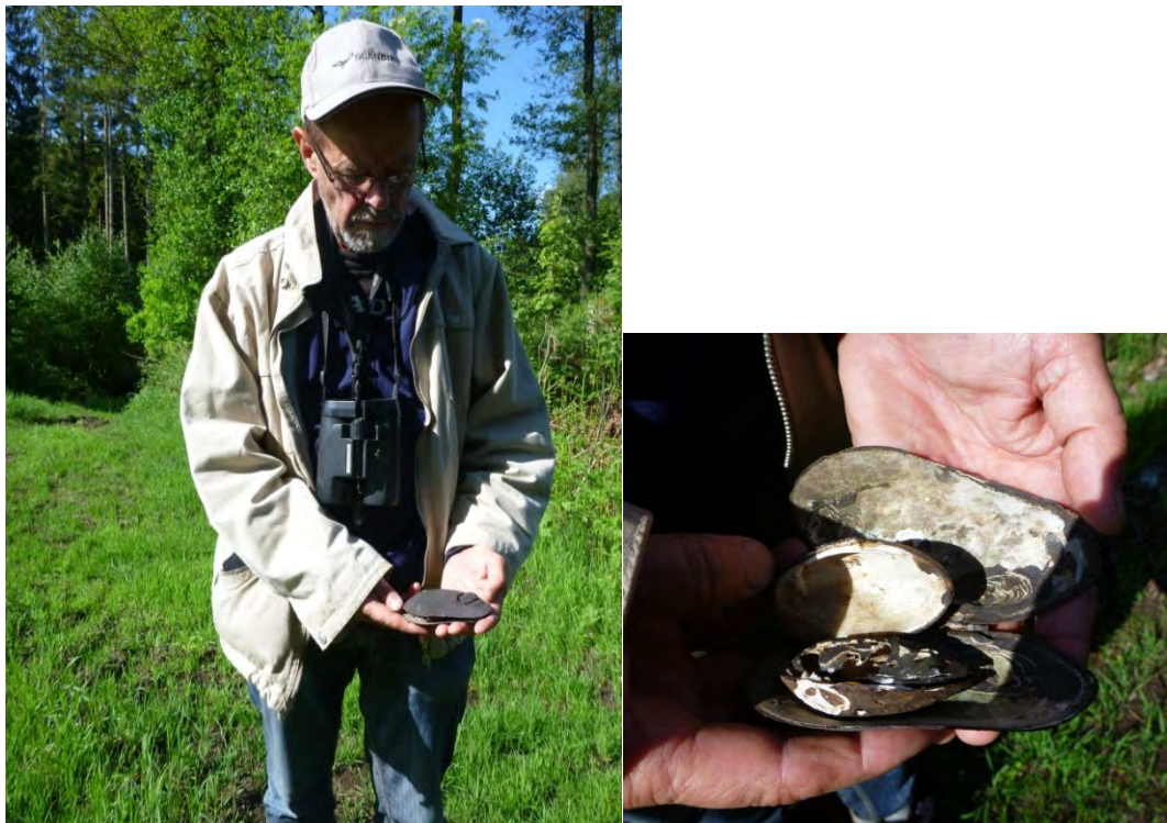
Figur 1. Markägaren visar upp de skal av flodpärlmussla som han hittade vid Pinkabäcken för cirka 10 år sedan.

Flodpärlmusslan ( Margaritifera margaritifera ) är en av Sveriges sju inhemska stormusselarter och är dessutom en Natura 2000-art. I Sverige är flodpärlmusslan Starkt hotad (EN) enligt rödlistan 2010 (ArtDatabanken, SLU). I Skåne är flodpärlmusslan mycket sällsynt och finns endast kvar i ett fåtal vattendrag, bl.a. i Almaåsystemet (088 Helge å) som Pinkabäcken utgör en del av. Den är därmed, till skillnad från i övriga Sverige, mer hotad i Skåne än vad tjockskalig målarmussla ( Unio crassus ) är. De skånska flodpärlmusselbestånden består av mycket gamla individer och det saknas nästan helt yngre individer. I och med att flodpärlmusslans föryngring inte fungerar är bestånden på utdöende i Skåne. För att kunna skydda bestånden och deras livsmiljö är det därför viktigt att få ökad kunskap om var i Skåne det fortfarande finns kvar bestånd med levande flodpärlmusslor, vilka faktorer som hotar respektive musselbestånd samt vilka åtgärder som är möjliga att genomföra för att gynna musslan.