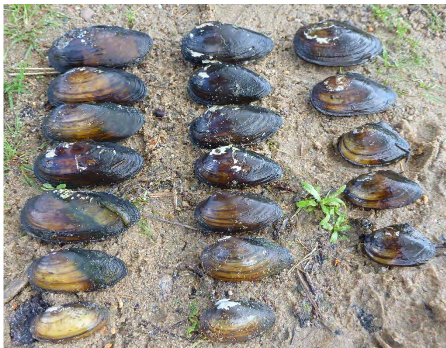
Figur 8. Tre stormusselarter hittades i Sjömellets inlopp i Ballingslövssjöns samt utmed sjöns norra strand. Från vänster: äkta målarmussla, spetsig målarmussla och allmän dammussla.

Musslor samlades in från Sjömellets inlopp samt Ballingslövssjöns norra strandzon. Sammanlagt hittades tre arter stormusslor: spetsig målarmussla ( Unio tumidus ), äkta målarmussla ( Unio pictorum ) och allmän dammussla ( Anatina anatina ), (Figur 8). För utförligare information av musseldata, hänvisas till musselportalen ( www.musselportalen.se ).