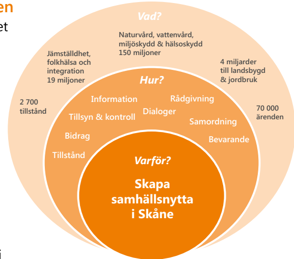
Figur: En "gyllene cirkel" över Länsstyrelsen Skåne.

■ ■ Snart firar länsstyrelserna 400 år. I mitten av 1600-talet delade Axel Oxenstierna in landet i hövdingedömen och länsstyrelserna blev ett slags regionala regeringskontor. Landshövdingen blev kungens ställföreträdare i länet.