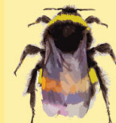
Mörk jordhumla Bombus terrestris