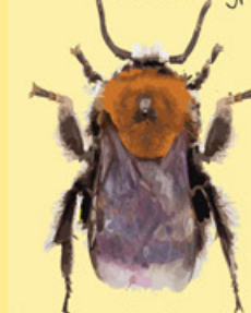
Hushumla Bombus hypnorum