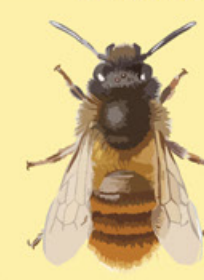
Rödmurarbi Osmia bicornis