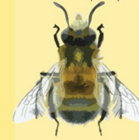
Vårpälsbi Anthopora plumipes