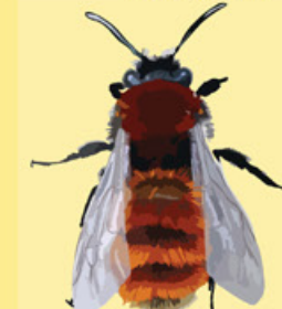
Glödsandbi Andrena fulva