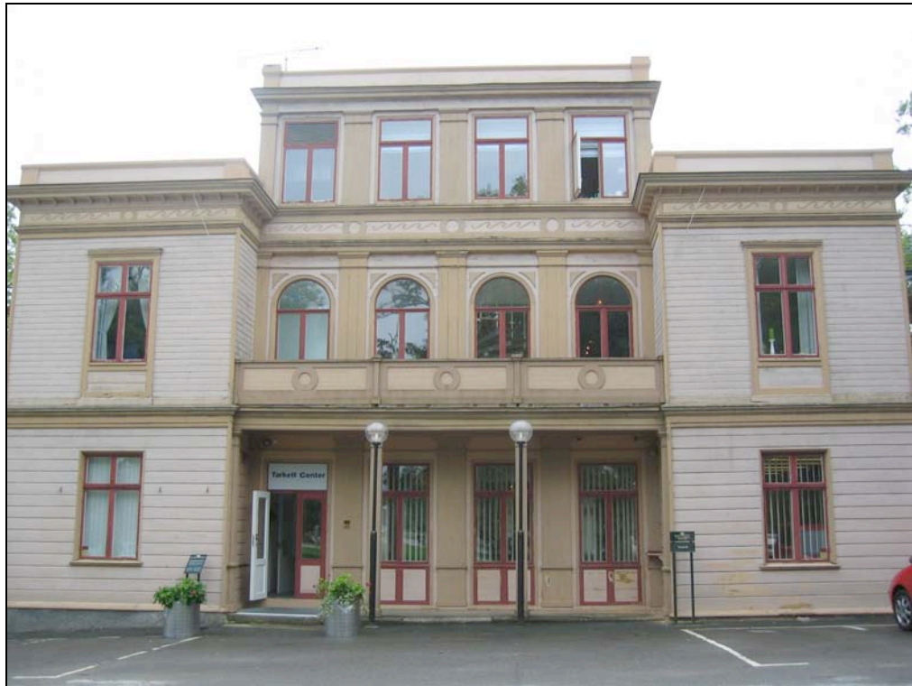
060821 Utseende innan renovering