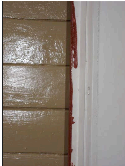
Slutbesiktning 061120. Målningen godkändes inte eftersom det inte var färdigt, kladdigt målat i övergångar samt att rondellspår från slipen var synliga i panelen.