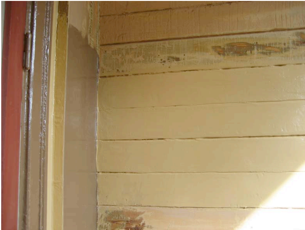
060911. Provstrykning av kulörer