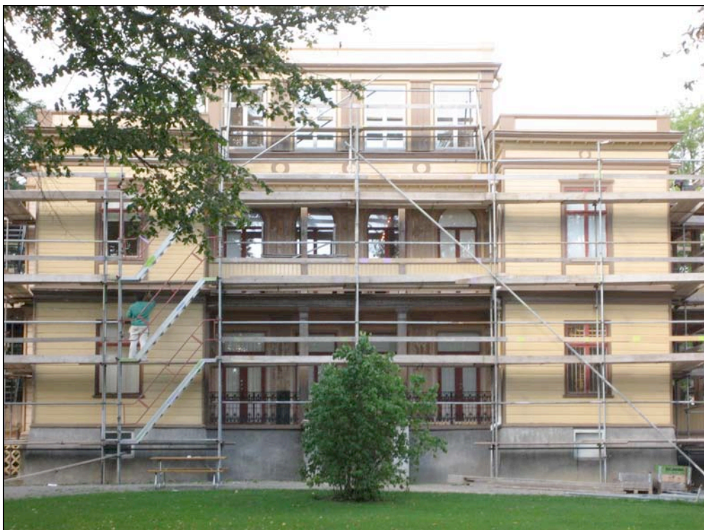
060920 Målning av fasaden har börjat