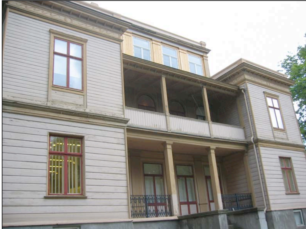
060816 Utseende innan renovering