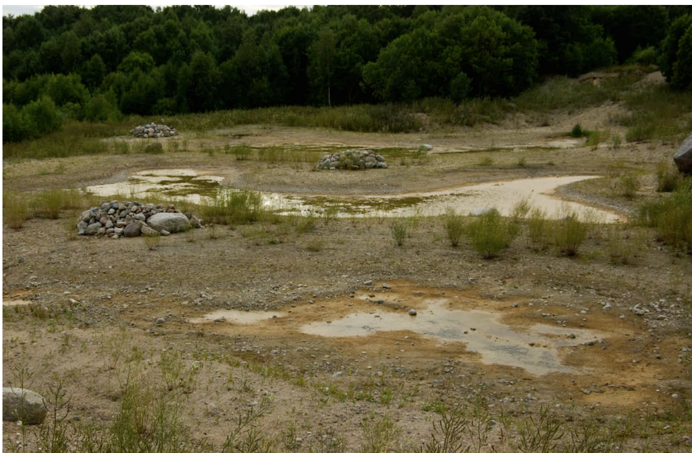
Överst ses alger i mellersta dammen och nederst ses de tre dammarna i juli.