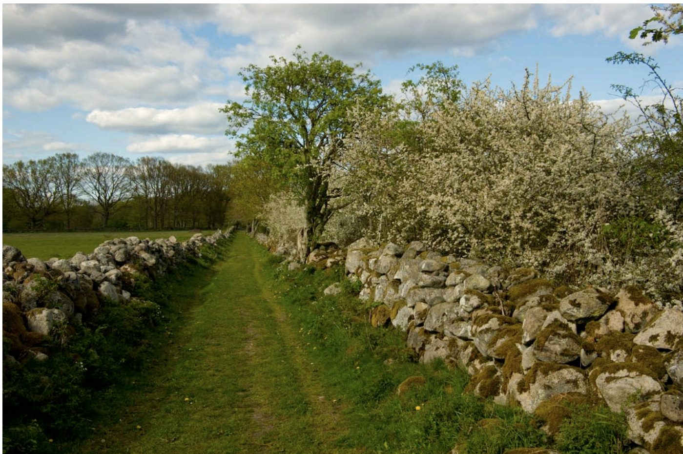
Fägatan ut mot strandängen.