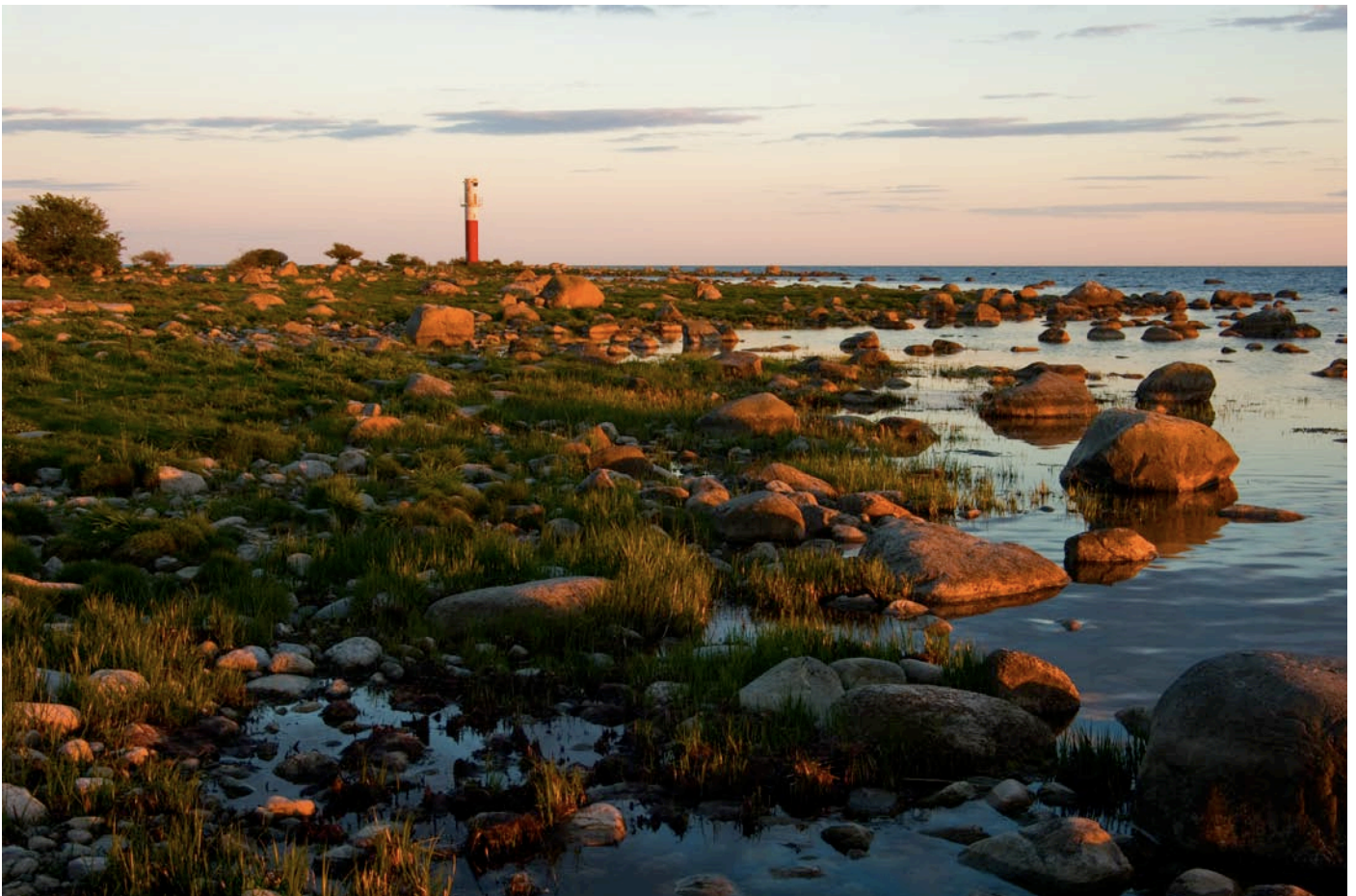
Överst ses lekvattnet ute på udden och nederst ses strandängen nere vid havet.