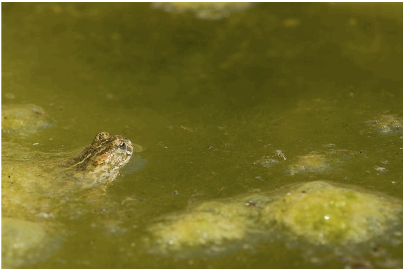
Strandpadda i algsoppa i den nya dammen 29/6.