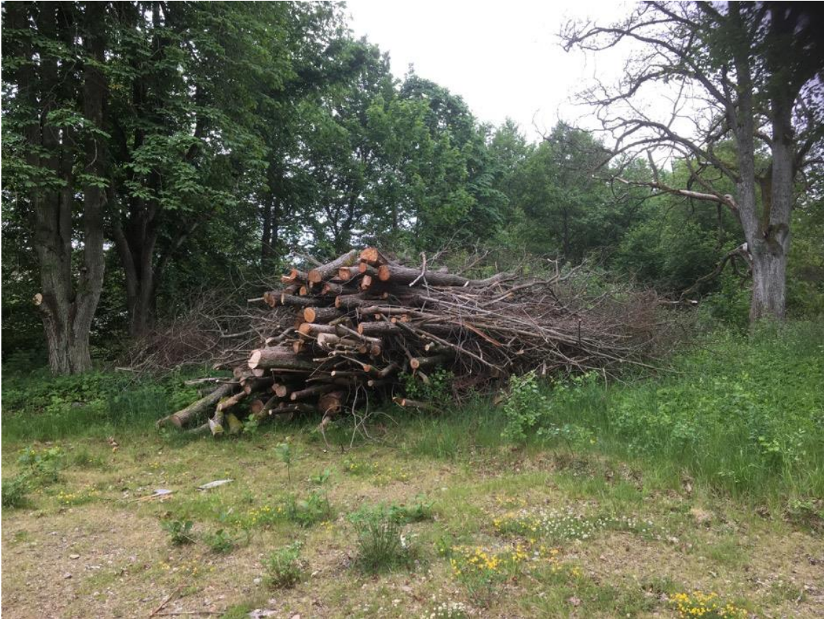
Figur 11. Faunadepå dominerad av alm i centrala Olofström.

Kantarellmussling (S) – signalart som främst förekommer på klen, nydöd hassel. En art som är relativt vanlig och möjligen på spridning.