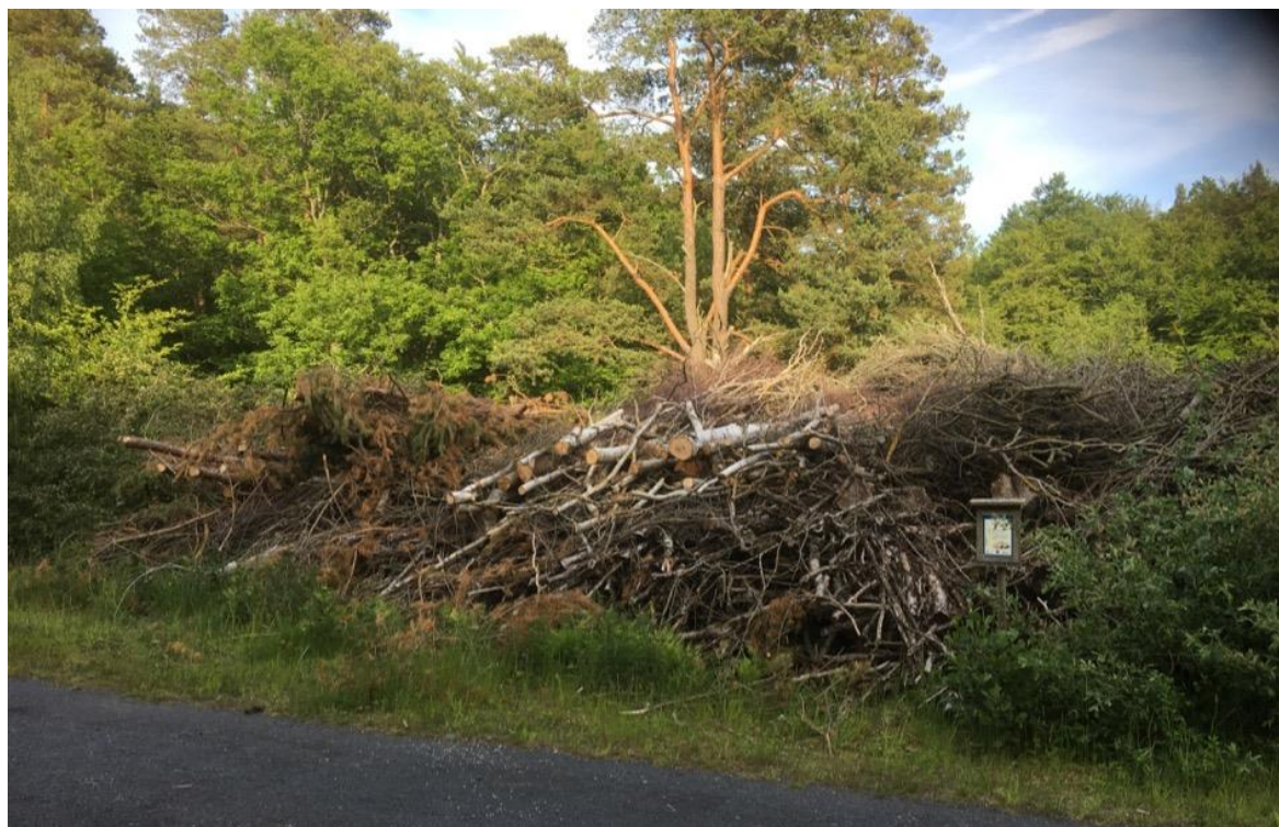
Figur 9. Faunadepån av triviallöv och barr på Sternö, Karlshamns kommun.