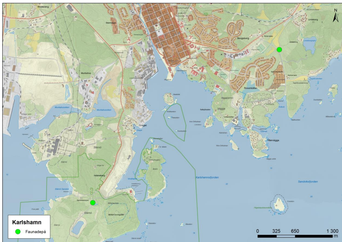
Figur 4. Inventerade faunadepåer i Karlshamn.