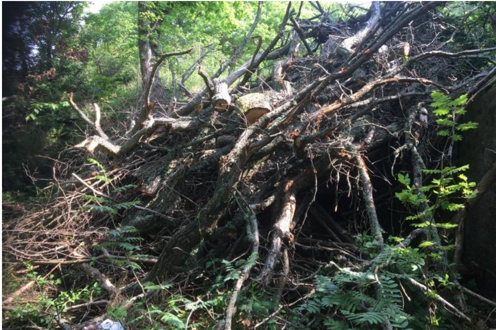
Figur 7. Faunadepån vid Karlskrona S.

I övrigt fanns här rikligt med tvåvingar som snäppflugor, svampmyggor, harkrankar och rikligt med parasitsteklar och både humlor och getingar med bon inne i vedhögen.