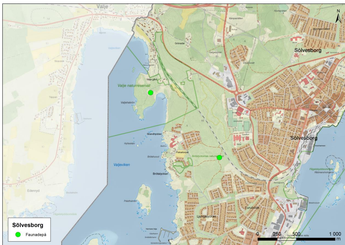
Figur 5. Inventerade faunadepåer i Sölvesborg.