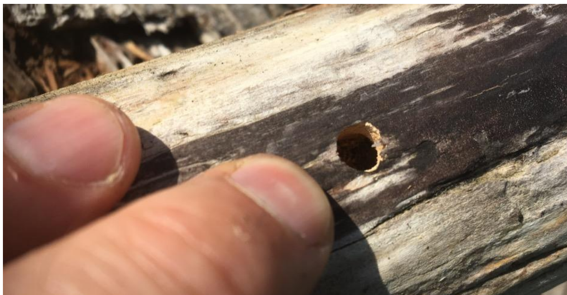
Figur 8. Färskt utgångshål av bokblombock.