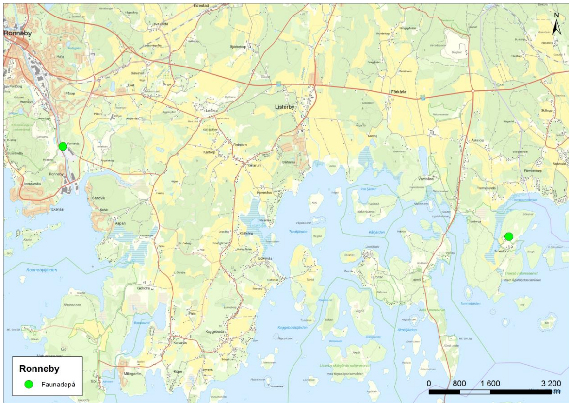
Figur 2. Inventerade faunadepåer i Ronneby.