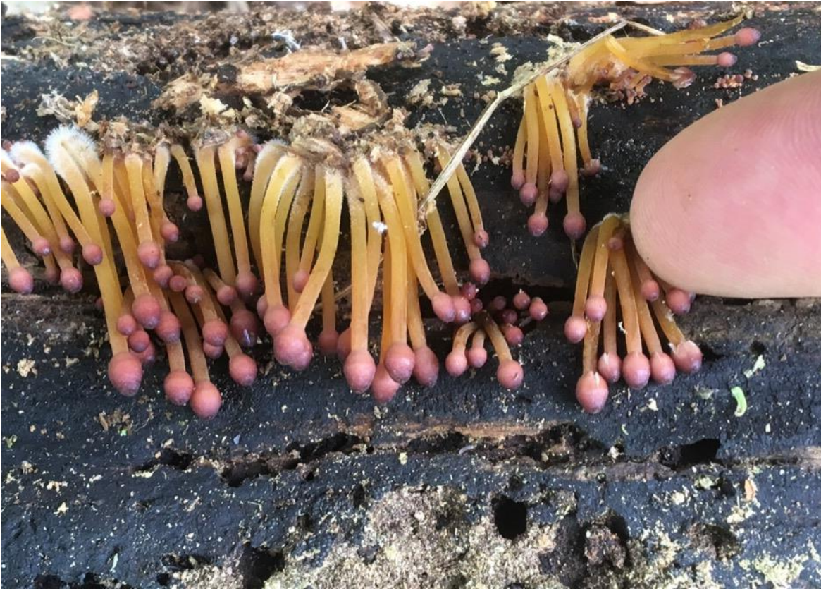
Figur 13. Gulfotshätta från den grova eklågan i Valje NR.