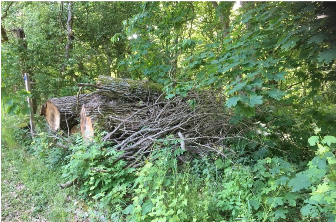
Figur 7. Del av faunadepån i Fornanäs, Ronneby kommun.

Prydnadsbock Anaglyptus mysticus NT - utvecklas i död ved av bok, ek, hassel och andra hårda lövträd. Noterades i blommorna på en av hagtornsbuskarna.