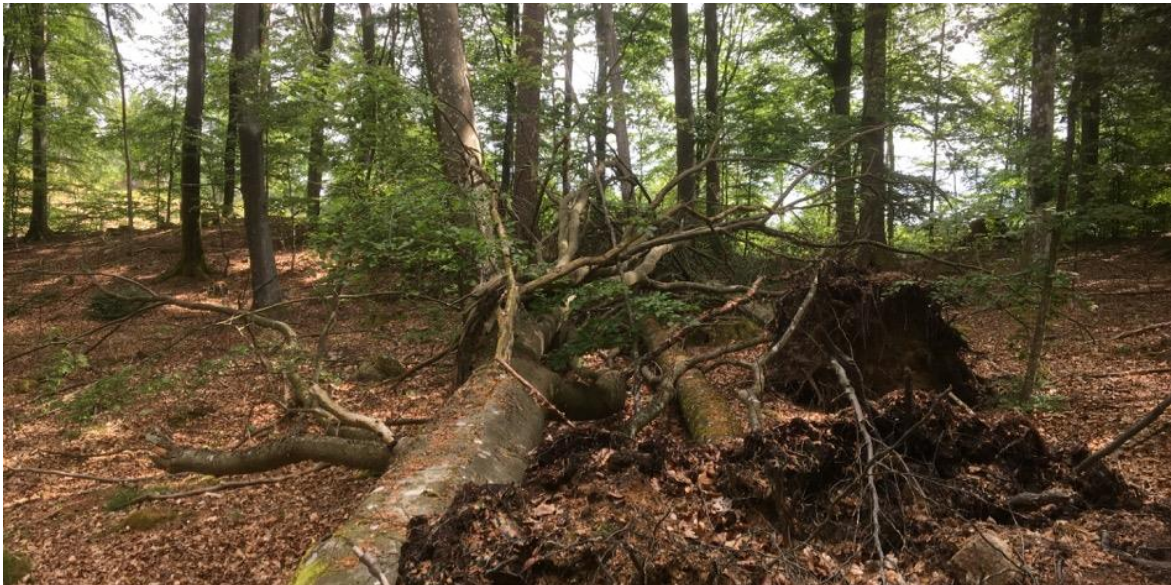
Figur 10. De två bokarna i Lilla Holje bokskog.

Prydnadsbock Anaglyptus mysticus NT - utvecklas i död ved av bok, ek, hassel och andra hårda lövträd.