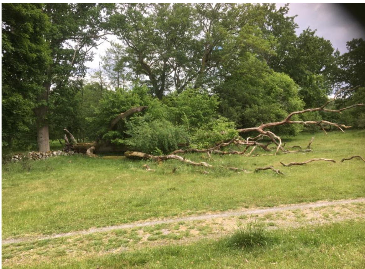
Figur 12. Grov ek som faunadepå i Valje naturreservat.

Gulfotshätta Mycena renati S, NT 2000 – förekommer i bland- och lövskog från mellersta Sverige och söderut. Vitrötare som lever på stammar och grenar.