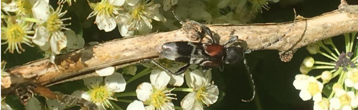
Figur 6. Prydnadsbock fotad vid veddeponin i norra Karlskrona.

Prydnadsbocken föredrar lite äldre ved, men utnyttjar säkerligen även nydöd ved och kan fortsätta använda samma veddelar upp till tio år. Den nyttjar hassel, ek, bok och andra lövträd med hård ved, och både gnagspår och imago är relativt enkla att hitta. Detta är en art som säkerligen trivs i den ved som erbjuds vid solexponerade veddepåer.