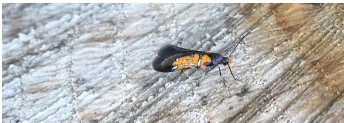
Figur 8. Kilskriftspraktmal fotad vid veddeponin på Sternö.

Kilskriftspraktmal Schiffermuelleria schaefferella NA – möjligen lokal etablering av raritet som beskrevs av Linne 1758 och som sedan dess inte har observerats på 250 år. Har hittats på importvirke i Uppland, Halland och Blekinge. Ursprunget i det här fallet är förmodligen detsamma. Hamnen i Karlshamn importerar dryga 20 000 kubikmeter/år av björk och asp från Baltikum och Ryssland (Svensson, 2015) med stor sannolikhet kommer djuret från detta virke. Den lever på svampangripen lövved och/eller under barken av detsamma. Det intressanta är om den här har etablerat sig i faunadepån och möjligen även i närområdet.