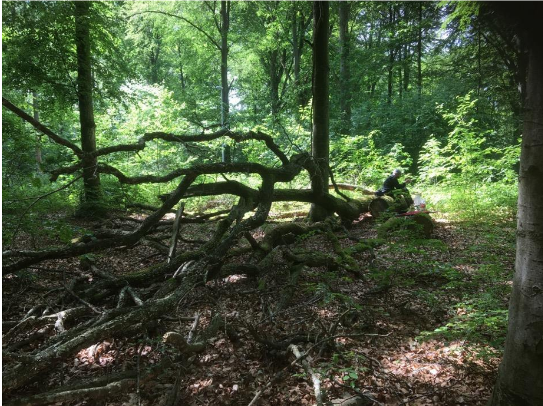
Figur 14. Faunadepå i form av några ekstockar och en toppdel i Sölvesborg.