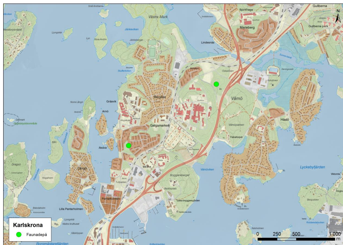
Figur 1. Inventerade faunadepåer i Karlskrona.