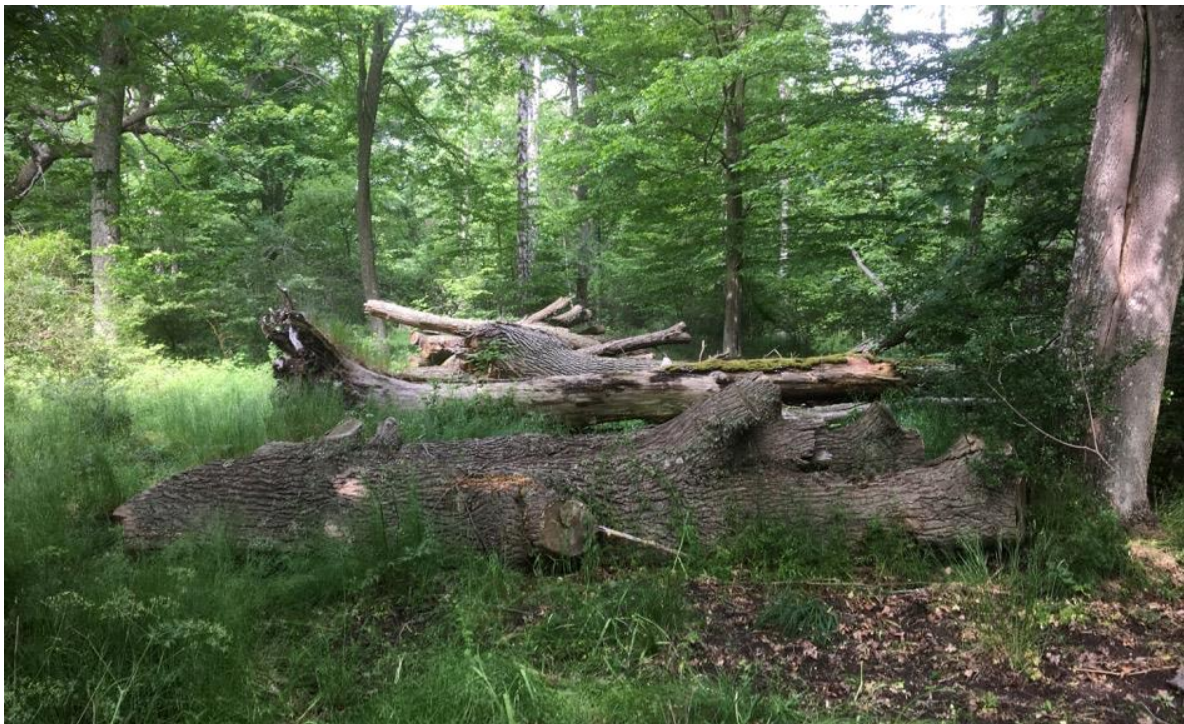
Figur 9. Faunadepån i Tromtö NR.

Slät lövbarkskinnbagge Aneurys laevis VU - är en mycket ovanlig skinnbagge som sedan 1980-talet bara hittats på en handfull platser i landet, varav tre i Blekinge. Den lever i svampig ved på ädellövträd. På en av ekstockarna, i anknytning till en äldre svampangripen vedskada, noterades en vuxen individ tillsammans med flera nymfer.