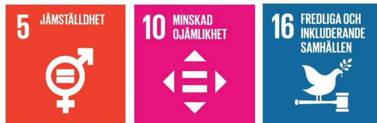
Figur 1: Bild på tre av de globala målen som har bäring på strategin

Agenda 2030, med de 17 globala målen, antogs av världens länder 2015 för att uppnå en fredlig och hållbar utveckling till 2030. De globala målen i agendan syftar till att, genom ett globalt samarbete, utjämna världens ojämlikheter, förverkliga de mänskliga rättigheterna och utrota extrem fattigdom samt att lösa klimatkrisen. Målen i Agenda 2030 omfattar tre dimensioner av hållbarhet: ekonomisk, miljömässig och social hållbarhet. Målen är odelbara och gäller alla människor i alla länder, utifrån sina olika förutsättningar. Strategin Jämställt Blekinge 2024–2027 har huvudsakligen bäring på mål 5 (jämställdhet), mål 10 (minskad ojämlikhet) och mål 16 (fredliga och inkluderande samhällen):