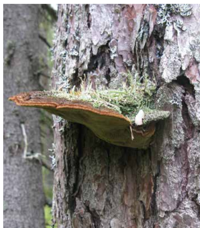
Tallticka ( Porodaedalea pini ). Svampen kan bli så gammal att det börjar växa lav på den.