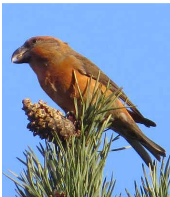
Större korsnäbb ( Loxia pytyopsittacus ), en ljudlig skönhet i rött.