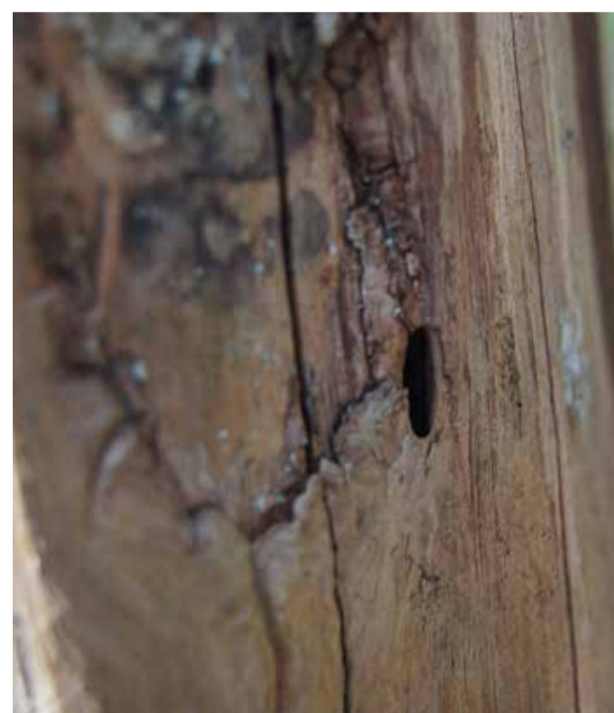
Kläckhål efter större flatbagge ( Peltis grossa ).

Följ vandringsleden mellan grova tallar och under lavklädda grenar. Stanna till vid kolarkojan, där finns ett fotoalbum med fotograf Bengt Erkers bilder från Hartjärns skogar. Ta med albumet ut till Bengts fotopunkter och se hur naturen i reservatet har förändrats sedan 1976. Kom ihåg att lägga tillbaka albumet i kolarkojan när du är klar!