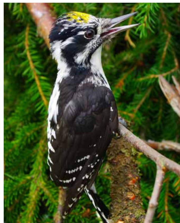
Tretåig hackspett ( Picoides tridactylus ).

Väldiga block med mossa som mössa. Svarta stubbar med berättelser om historiska bränder och mystiska växter utan klorofyll. Välkommen till en artrik värld bland tall, gran, lav och mossa.