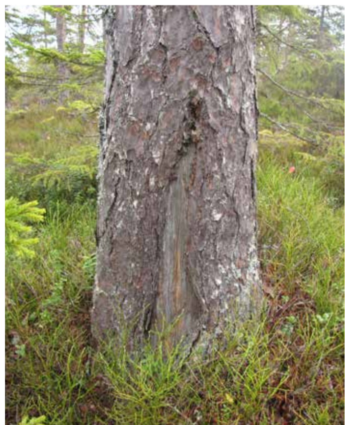
Efter en brand vallar tallen över den skadade veden med ny bark.