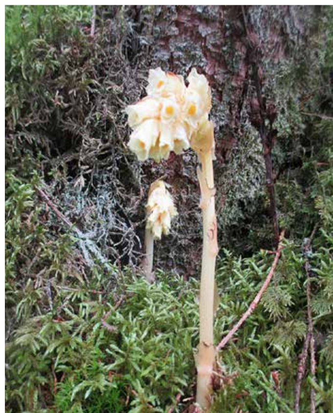
Tällört ( Monotropa hypopitys ).