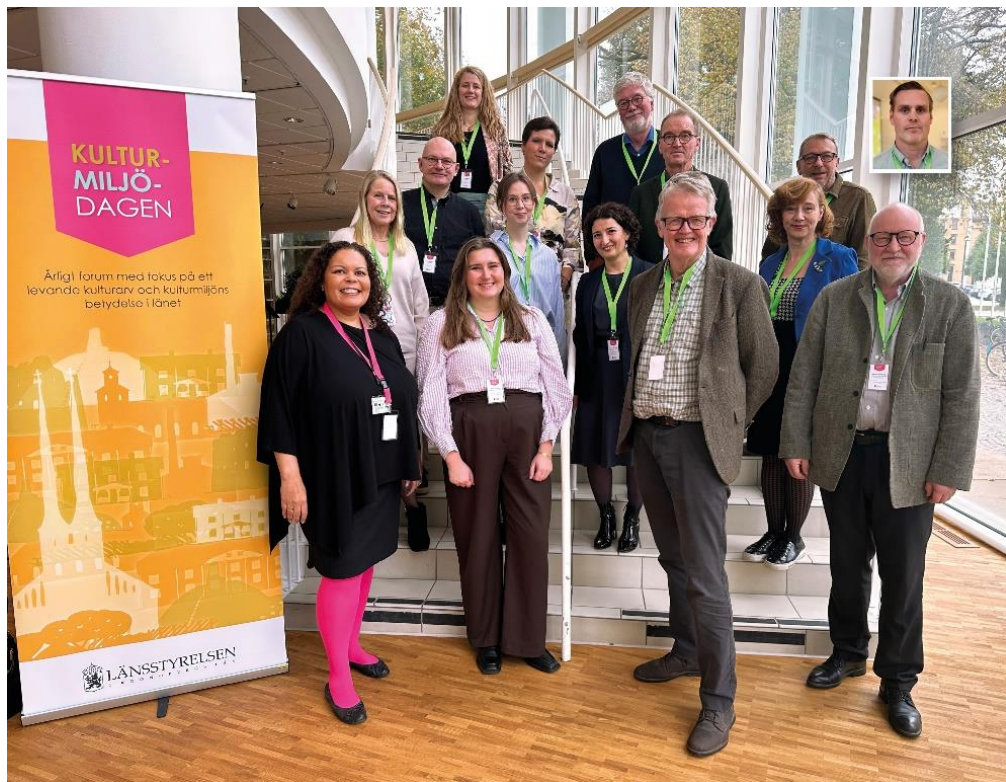
Samtliga föredragshållare vid Kulturmiljödagen 2023.

Bland föredragshållarna på Kulturmiljödagen 2023 var 50 procent kvinnor och 50 procent män.