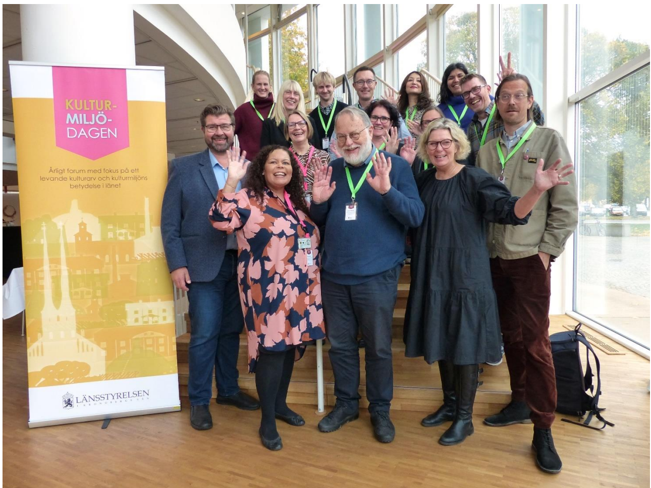
Glada föredragshållare vid Kulturmiljödagen 2024.

Av deltagarna var 63 procent kvinnor och 37 procent män. Bland föredragshållarna var 57 procent kvinnor och 43 procent män.