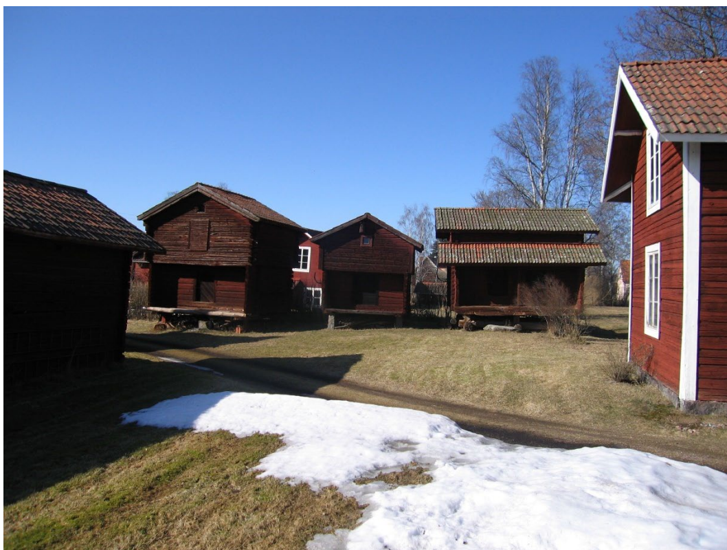
Figur 2. Berg Olles parhärbre står i gårdsmiljö, men traditionsenligt utanför gårdsfyrkanten.

Berg Olles parhärbre från 1600-talets början står som det östligaste i en rad av tre rödfärgade härbren, alla vända mot söder, bland gårdsmiljöer med ursprung i Siljansbygdens äldre byggnadsskick. Härbrena är på traditionellt vis placerade utanför gårdarnas kringbyggda strukturer. Norr om gården är marken öppen.