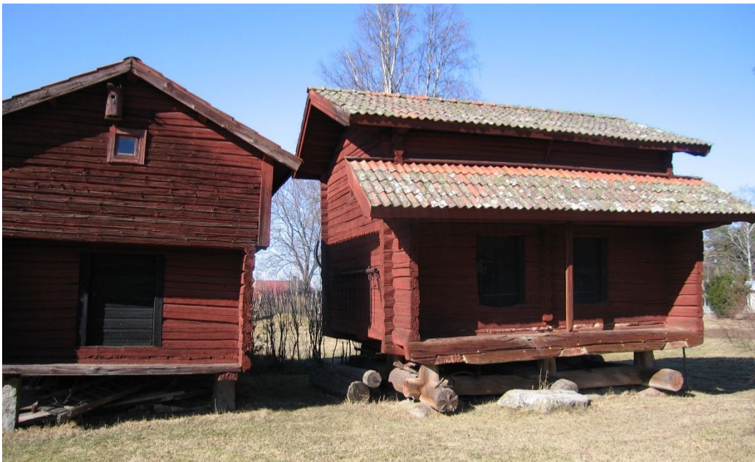
Figur 5. Berg Olles parhärbret står i en rad av tre rödfärgade härbren, alla vända mot söder, vid samma gård.