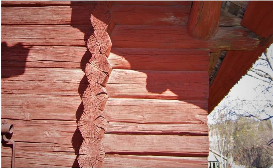
Figur 4. Knutarna på parhärbret är mycket täta, så kallade rännknutar, och har korta halsningar. Rännknuten är den enklaste knuten och tyder på mycket tidig konstruktion. Även den urnliknande formen är ett tidsuttryck som tyder på 1600-tal.