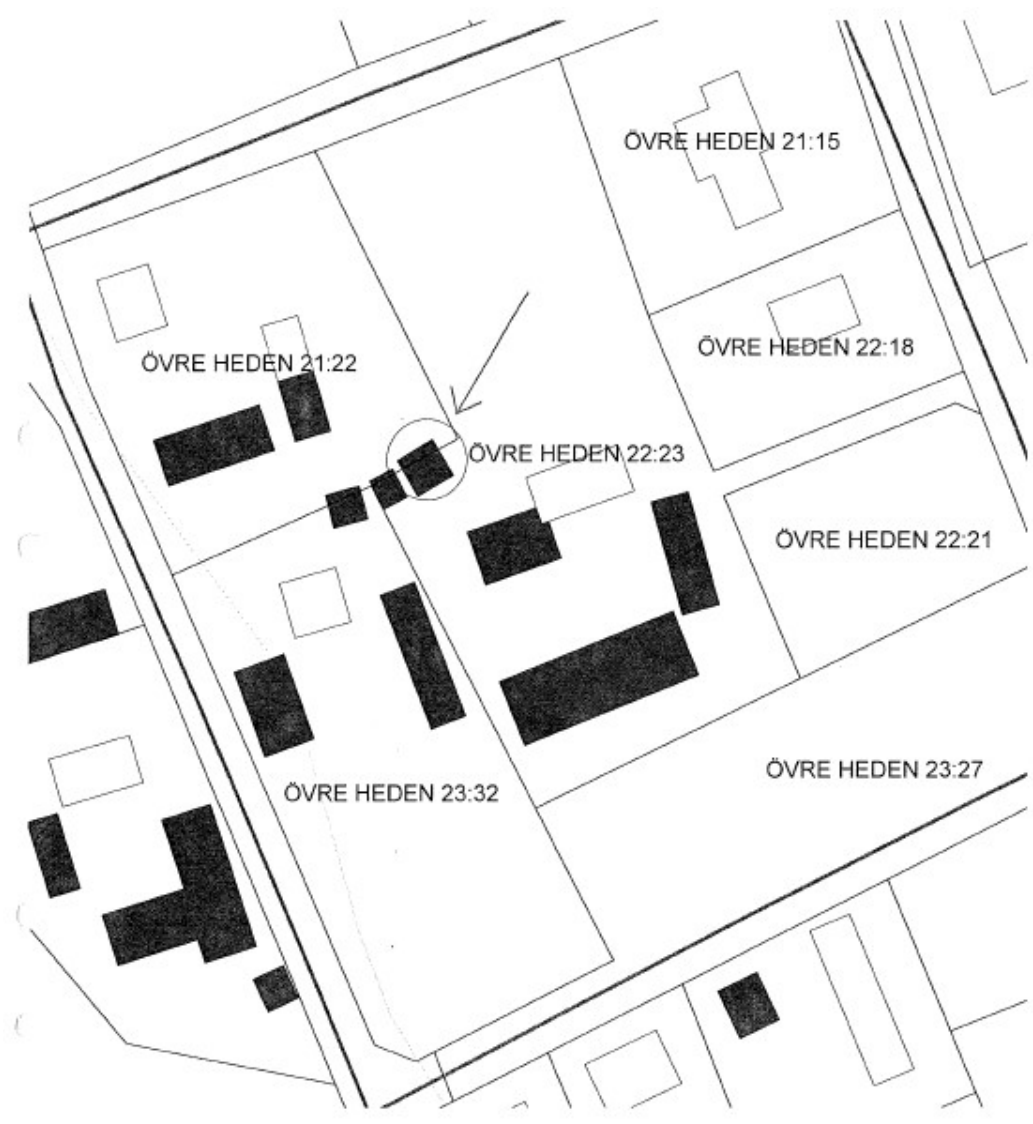
Figur 6. Situationsplan Berg Olles parhärbre, ur beslut 2007.09.03.