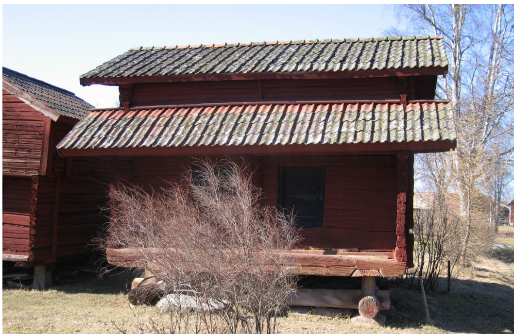
Figur 3. Det är troligt att härbret står på ursprunglig plats eftersom det saknar flyttmärken.

Invändigt är inredningen välbevarad. I bottenvåningens högra rum finns en skyddsbränning mot onda väsen. Saltutfällningar påminner om härbrets funktion som förrådsbyggnad, bland annat för matvaror. I övervåningen finns små gluggar för ljusinsläpp, ett försett med ett äldre järnsmide. Taket består underst av ett laggtak, en ålderdomlig takkonstruktion bestående av tätt lagda stockar eller kluvna stockar som hakas i urtag i gavlarna. På laggtaket ligger pärt och tegel i lager ovanpå varandra.