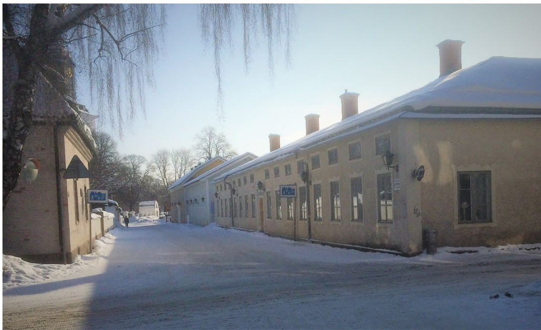
Figur 1. Gården ligger i Hedemoras äldre stadskärna. I fonden kyrkogården.

Bos-Kalles gård ligger i Hedemoras gamla stadskärna, med ett dominerande läge på hörntomten mellan Kyrkogatan, Hökargatan och Trädgårdsgatan. På den inneslutna gårdsplanen är en trädgård anlagd, med gräsmatta och grusgångar och växtlighet i form av bland annat en gammal kastanj, en berså där ett enkelt lusthus tidigare funnits.