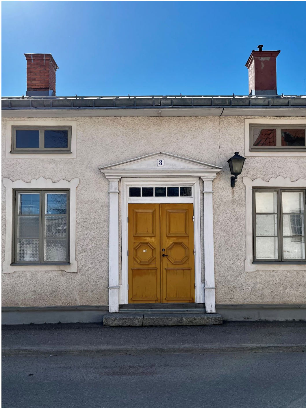
Figur 3. Entrén mot Kyrkogatan.