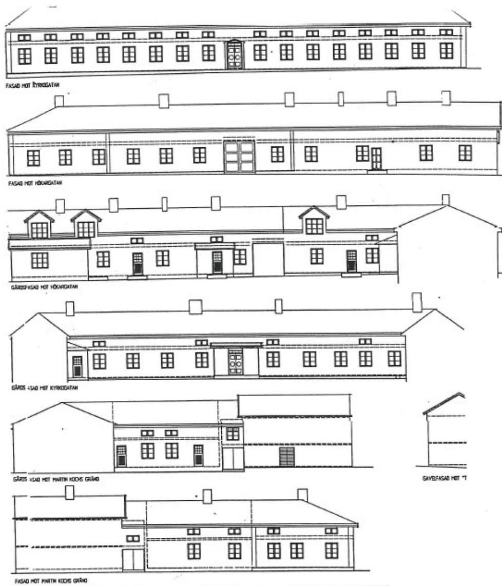
Figur 2. Uppmättningsritningar, NCC 1990.