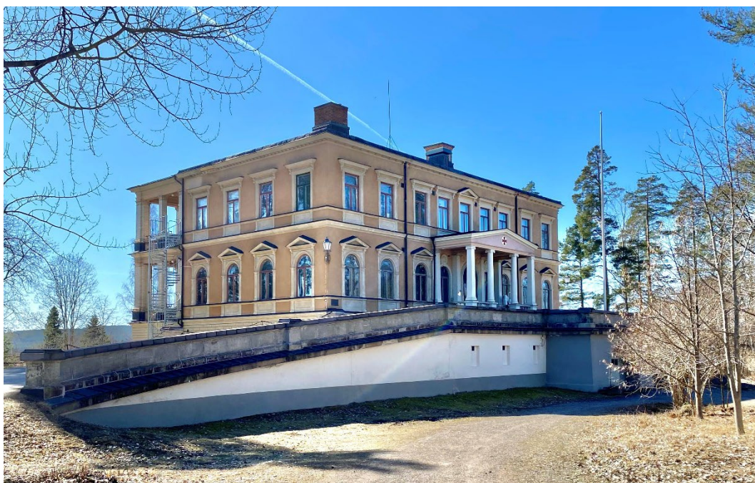
Figur 3. Östra fasaden. En bred uppfartsramp med balustrad leder upp till entren.