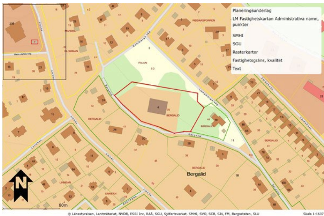
Figur 10. Situationsplan för Bergalid 25, ur beslut 2019.05.13.