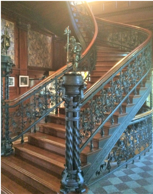
Figur 5. Trappan i hallen är tillverkad av Domnarvets järnverk.