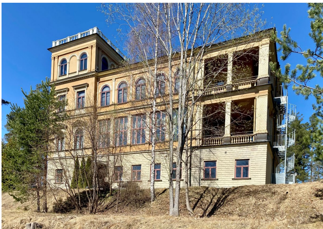
Figur 2. Västra fasaden.