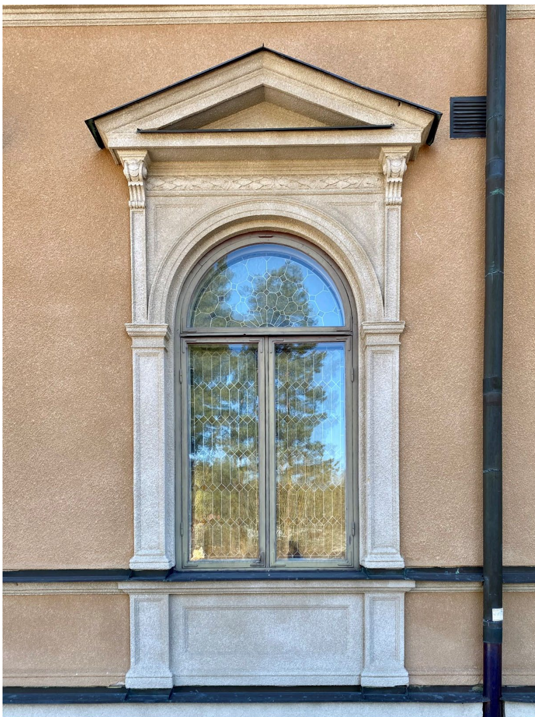
Figur 4. Bottenvåningens fönster är rikt utsmyckade med pilastrar, tympanonfält och ornerade konsoler och listverk. Notera de blyinfattade rutorna med färgat glas.