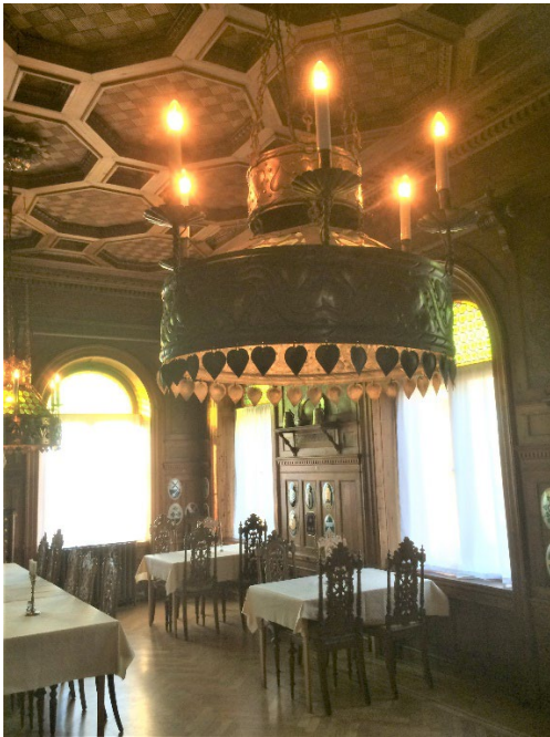
Figur 7. Matsalen, med kasettak i furu ritat av Erik Johan Ljungberg själv.