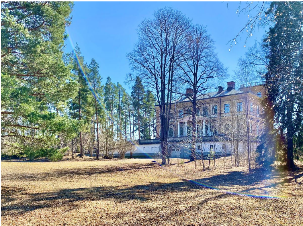
Figur 1. Byggnaden ligger i parkmiljö.

Bergalid är en monumental patriciervilla från sekelskiftet 1900 belägen i stadsdelen Villastaden i Falun inom Världsarvet Falun. Byggnaden ligger i parkmiljö.