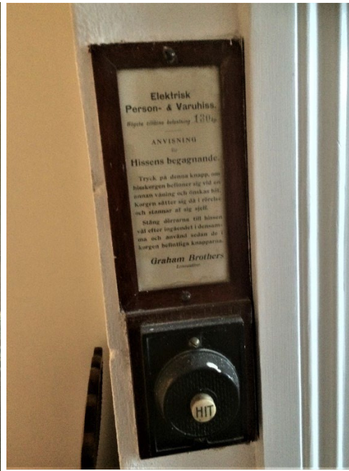
Figur 8. Huset är fullt av för tiden innovativa tekniska installationer, som den här elektriska hissen.