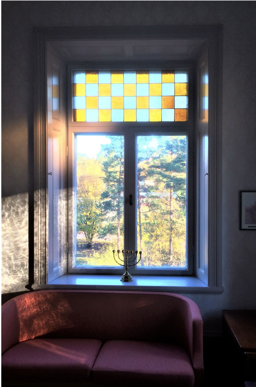
Figur 9. Vilket rum? Kungarummet?