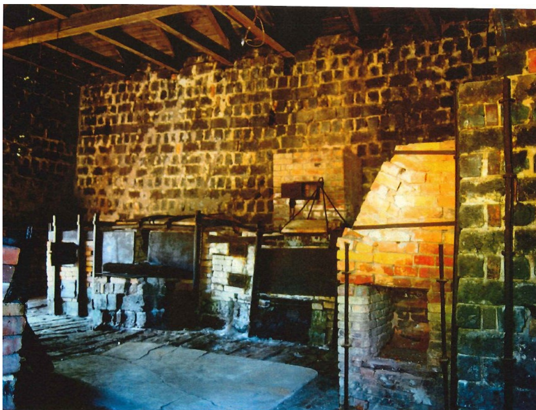
Figur 2. Bevarad ugsinredning i Silverhyttan.

Av de bevarade byggnaderna på området är Silverhyttan en av de äldsta. Den uppfördes 1884. Framställningen av silver och guld pågick fram till början av 1920-talet. Ca 250 kg silver och 100 kg guld per år producerades i Silverhyttan. Silverhyttan består av två sammanbyggda byggnadskroppar uppförda av gjutna kopparslaggblock. Taket är täckt med tjärpapp. Den norra delen innehåller den s k kratshyttan med en större ugn för smältning av slagg från garningen s k krats. I den södra delen finns flera mindre ugnar för silver- och guldframställningen. Genom sin bevarade ugsinredning anses Silverhyttan vara unik i landet.