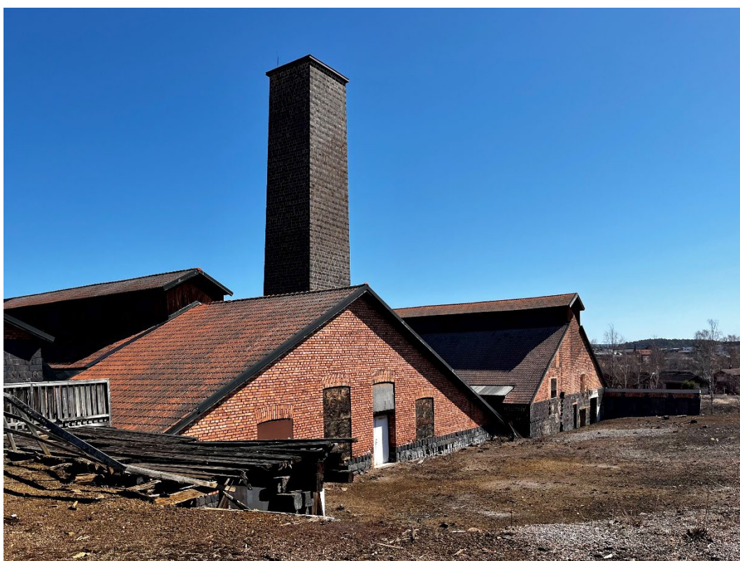
Figur 7. Extraktionsverket närmast i bild och Vitriolverket längst bort. Byggnaderna ligger parallellt med varandra. I mitten skorstenen.