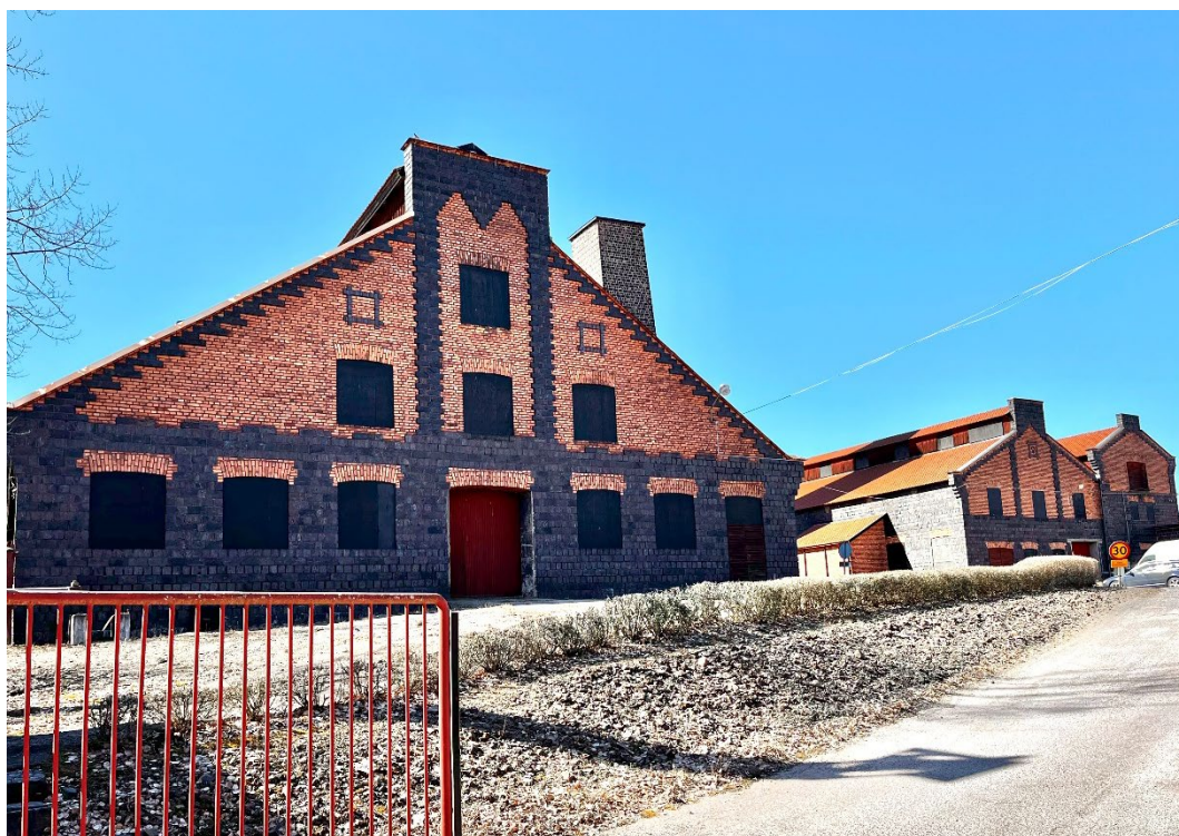
Figur 5. Vitriolverket, i samma medeltidsinspirerade stil som Extraktionsverket.

Väster om Vitriolverket finns ruiner av bl a en brandstation i slaggtegel.