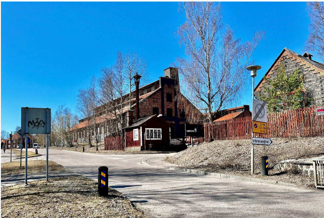
Figur 1. Det gamla industriområdets slaggstensbebyggelse ligger synligt på en höjd i stadsmiljön.

Anläggningarna ligger utmed Faluån, norr om Södra Mariegatan och stadsdelen Gamla Herrgården. Byggnaderna har en särpräglad utformning med fasader av gjutna kopparslaggblock och lertegel. Industriområdet har ett exponerat läge i den riksintressanta stadsmiljön i Falun.