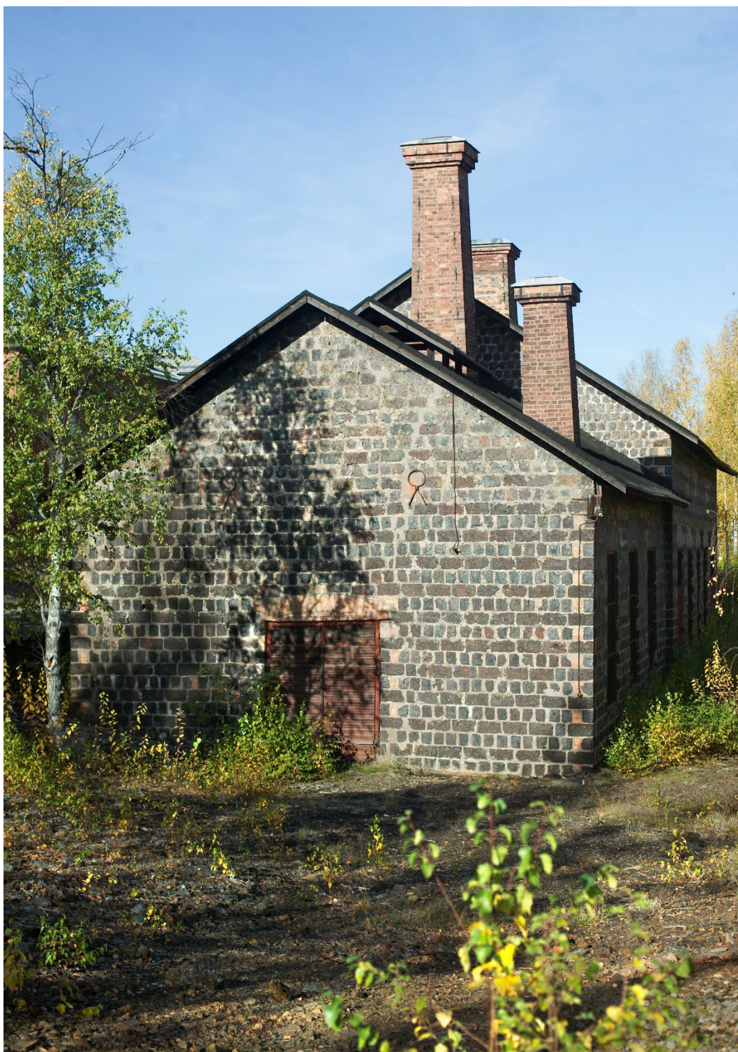
Figur 3. Silverhyttan består av två sammanbyggda byggnadskroppar.