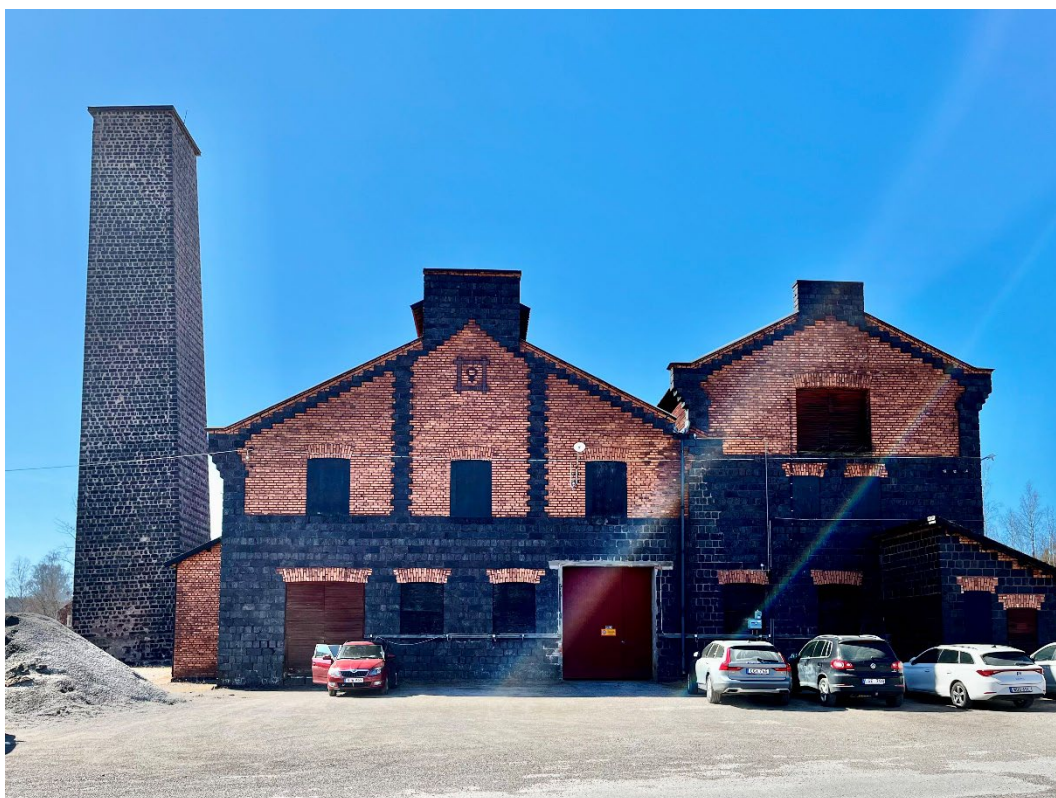
Figur 4. Extraktionsverket med den höga (numer förkortade) skorstenen till vänster.

I anslutning till extraktionsverket står en stor skorsten av gjutna kopparslaggblock. Den uppfördes 1878-79 och gjordes mycket hög, ca 60 meter, för att föra bort svaveldioxidröken från det intilliggande Extraktionsverket. Skorstenen började dock luta och vittra varför den 1924 kortades av till nuvarande höjd, 25 meter.