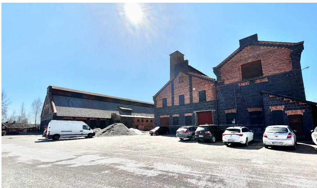
Figur 6. Industribebyggelsen har ett särpräglat utseende.