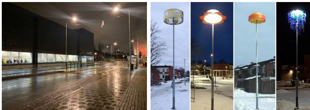
Idrottshall med levande fasad samt konstfull belysning - två goda exempel som skapar trygghet i stadsmiljön.

Dessutom kan effektbelysning bidra till god stämning, merinteraktion och användning och mer trivsel på utvalda platser.