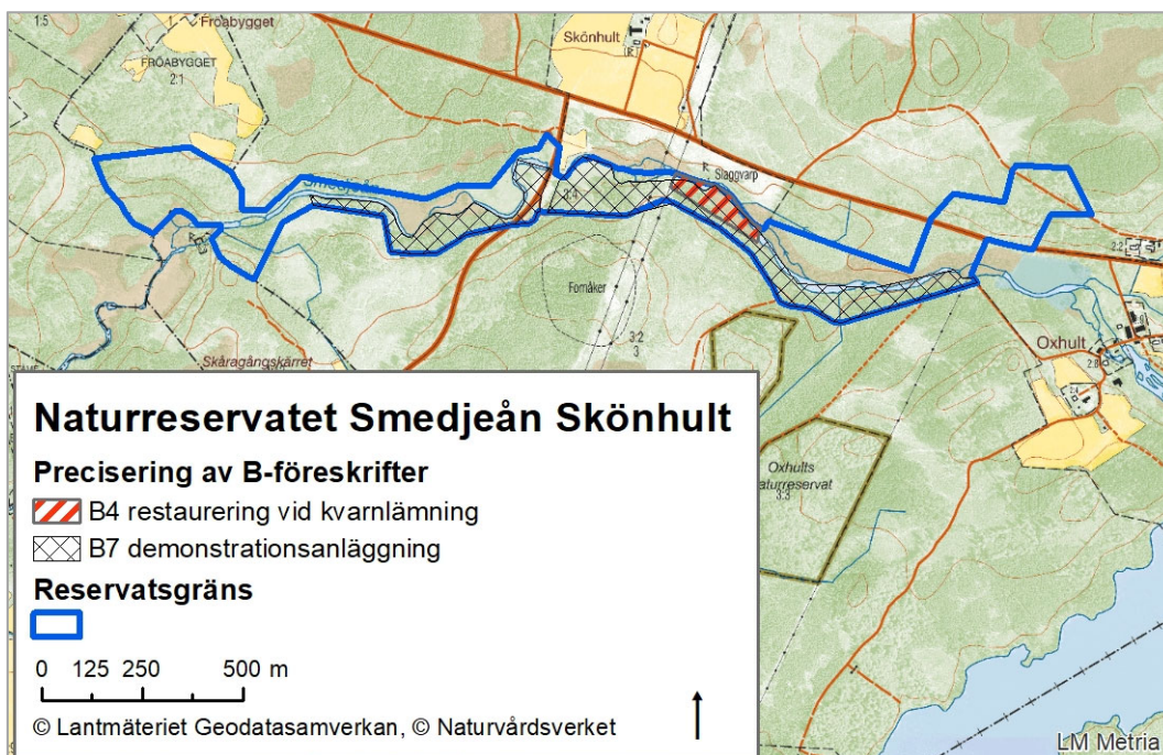
Karta 2: Kartan visar var i området vissa B-föreskrifter gäller.