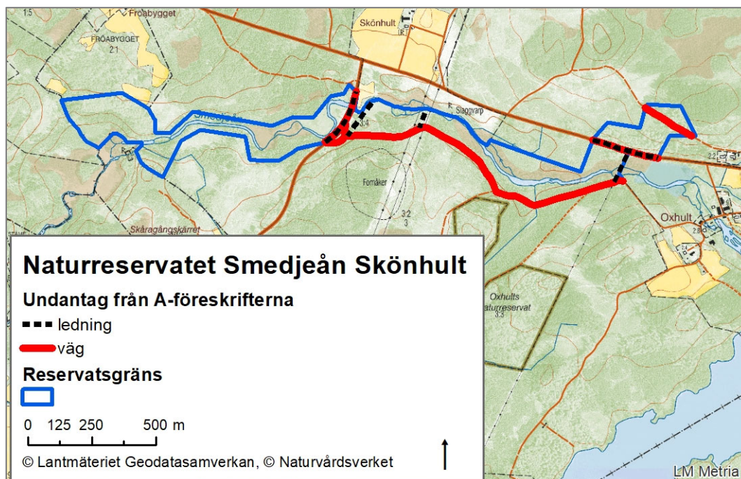
Karta 1: Kartan visar var i området vissa undantag från A-föreskrifterna gäller.