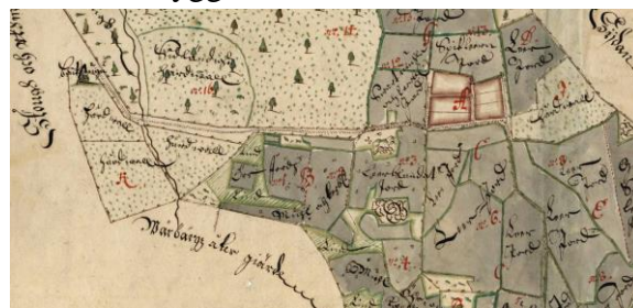
Gärdesgårdslandskap. Geometrisk avmätning Höckerkulla 1687. Lantmäteriet

Från järnålderns slut och kommande århundraden skedde en omfattande expansion av odlingslandskapet, bybildning och ett fastare odlingsystem samtidigt som det kom en rad tekniska innovationer såsom järnskodd spade, årder med järnbill och effektivare yxor. Den senare underlättade att hugga och klyva de stora mängder gärdslen som gick åt till byggandet av gärdesgårdar runt åker- och ängsgården som nu växte fram runt den ökande bebyggelsen.