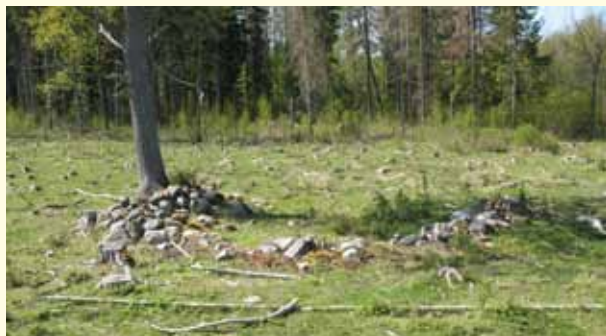
Stenkretsen efter röjningen.

Den uppkomna situationen blev besvärlig. Stormfällena i Götaland måste snabbt tas om hand. Skogsbolagen dammsög hela landet på skogsarbetare och maskiner.