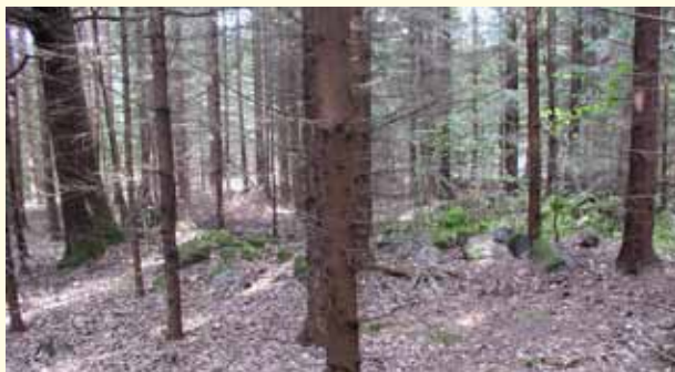
Den förunderliga stenkretsen innan röjningen, belägen SV om stigens södra del.

betesmarken omfattade två fornlämningsområden bestående av fossil åkermark. Det tänkta området skulle inte bara kunna fungera som betesmark utan även ge besökare en bild av ett gånget odlingslandskap. Området skulle kunna göras publikt.