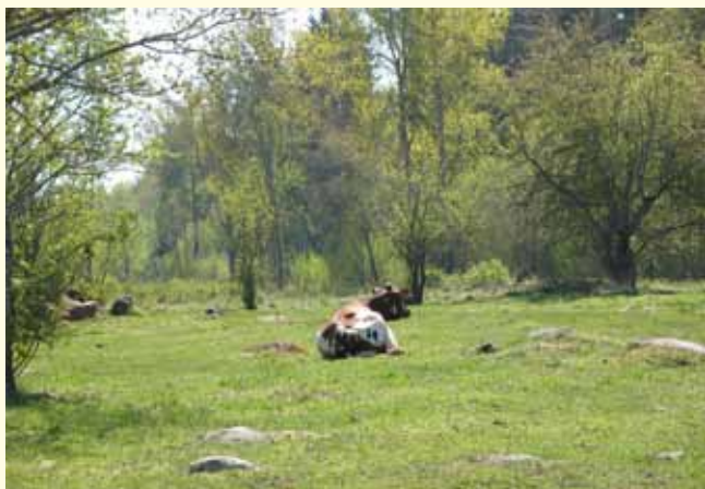
Pastoral idyll i Stora Sand. Maj månad 2011.

Utkörningen av virke och ris kunde först ske när marken blivit tjälad. Skogsbolaget låg i startgroparna. Så kom stormen Gudrun. Mellan den 8 och 9 januari 2005 förödde denna orkan nästan ofattbara ytor i främst Götaland men även Svealands skogsägare såg mycket av sin skog bli till vindfällen. I det aktuella området i Stora Sand föll ett hundratal granar. Trots detta skadades blott ett fåtal odlingsrösen.