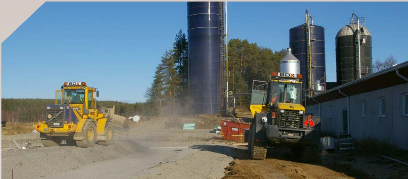
Det finns stöd för investering i ny-, om- och tillbyggnad av stallar eller motsvarande byggnader för animalieproduktion.

Det finns flera olika stöd som du kan söka om du planerar en investering för att öka ditt företags konkurrenskraft. Här sammanfattas de olika stöden som är riktade till dig som driver ett jordbruks- eller trädgårdsföretag och vill investera.