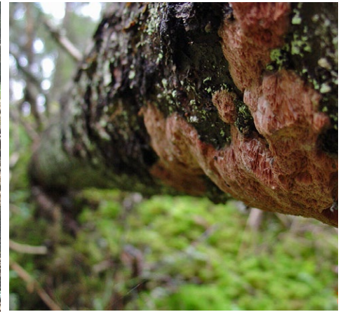
Kötticka på liggande, död granstam.

Naturreservatet Örvaremossen består av ett varierat område med en gammal skog på fuktig mark. Idag domineras området av en barrskog med gott om lövträd. Stora delar av reservatet nyttjades i äldre tider som slåttermarker. I söder gränsar området till naturreservatet Stenbäcken.