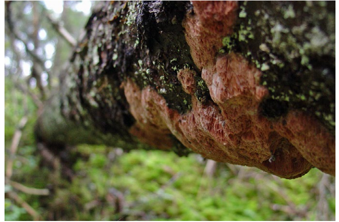
Kötticka på liggande, död granstam.

I områdets högre och torrare delar möter du en äldre barrskog. Här finns det gott om döda träd och träddeklar, till glädje för en mängd olika vedlevande svampar, mossor och insekter. Svampen ullticka och skalbaggen bronsbjon är några exempel. Den döda veden uppskattas även av hackspettar och andra fåglar som låter sig