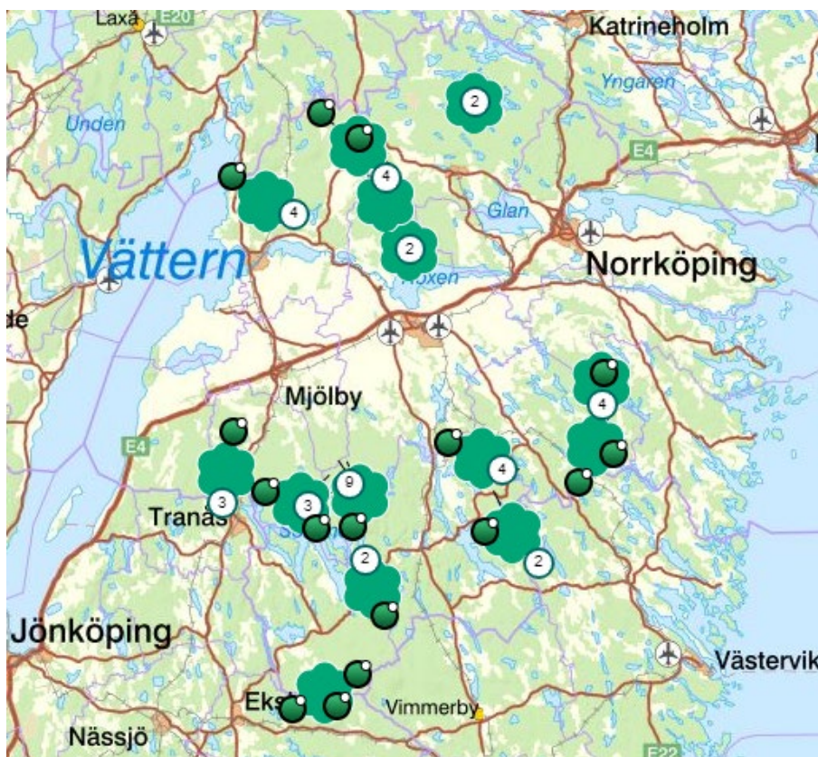
Figur 3, Lodjursföryngringarnas (familjegrunder) spridning i länet enligt inventeringsresultat 2022/23. Fem föryngringar delas med angränsande län och räknas som halva i länets inventeringsresultat.