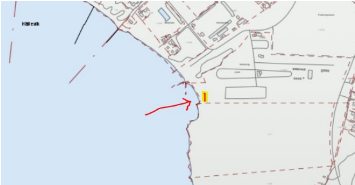
1. Hälleviks camping