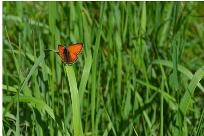
Violettkantad guldvinge.

I reservatets nordöstra delar växer det främst lövträd, där björk och asp dominerar med inslag av bland annat ek och ask. Här växer även buskar av hassel, olvon och skogstry och på marken finns växter som blåsippa och underviol. De västra delarna består till största delen av en lövrik barrskog, varav stora delar är sumpskogspartier med gran, bjök och klibbal på socklar. Socklar på träd är vanliga i sumpmarker. De bildas vanligtvis på grund av att vattenståndet varierar samt när träden dör och nya skott växer upp. På marken växer bland annat skärmstarr och gullpudra.